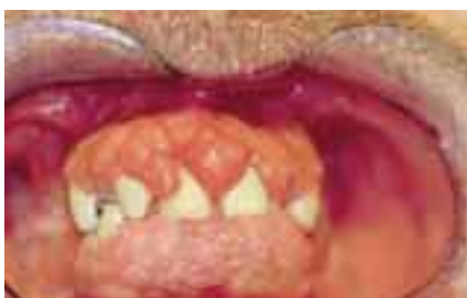
Bild 1 a och b. En hjärttransplantationspatient som behandlas med ciklosporin och kalciumantagonist. Patienten hade betydande gingival hyperplasi, som avlägsnades kirurgiskt. a = före behandling, b = efter behandling.

Gingival hyperplasi försvårar den normala dagliga rengöringen av tänderna och tandmellanrummen och ökar ansamlingen av plack, och kan sålunda upprätthålla en gingival inflammation. Å andra sidan främjas utvecklingen av hyperplasi av tandköttinflammationer i samband med dålig munhygien eller inflammationssjukdomen parodontit som framskridit längre i paradontium. Gingival hyperplasi börjar ofta i interdentalpapillerna och är i allmänhet mer prominent på tändernas labialytor än på palatinal- eller lingualytorna. I svåra fall har hyperplasin blivit allmän i hela tandområdet och kan utsträcka sig t.o.m. till tändernas ocklusalytor och gör sålunda tuggandet besvärligt (bild 1 a och b). Ofta är gingival hyperplasi förutom ett kosmetiskt också ett funktion-