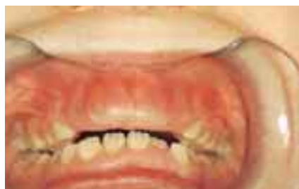
Bild 2 a och b. En 7-årig njurtransplantationspatient som behandlas med ciklosporin. Tandköttsvävnaden i övre främre tandraden är fibrotiskt tjock och hindrar de permanenta tänderna från att spricka fram (a). En gingivaloperation utfördes under anestesi och de övre framtänderna frilades. Bild (b) 2 veckor efter ingreppet.

Gingival hyperplasi orsakad av fenytoin beskrevs i den medicinska litteraturen för första gången för mer än 60 år sedan (4). I undersökningarna har man iakttagit en korrelation mellan å ena sidan bakterieplack och tandsten, och å andra sidan gingival hyperplasi orsakad av fenytoin (20,21). Hyperplasin börjar i det typiska fallet i papilla gingivalis och lokaliseras ofta till området för den främre tandraden. Hyperplasin kan förekomma på hela dentalområdet. Också på tandlösa områden har