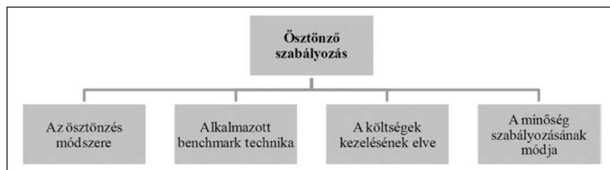
Az ösztönző szabályozás moduljai

Az ösztönző szabályozás moduljai egy-egy szabályozási döntésnek felelnek meg, és a szabályozó által az adott probléma kezelésére kialakított módszertanban öltenek testet. Az egyes modulokon belül választható módszertanok száma a szakirodalom bővülésével növekszik, továbbá a szabályozó hatóság is kidolgozhat speciális, új módszertanokat. Mivel az egyes modulokban alkalmazott módszertanok néhány alapvető megkövetéssel szabadon variálhatók, az ösztönző szabályozásnak gyakorlatilag végtelenül sok változata lehetséges.