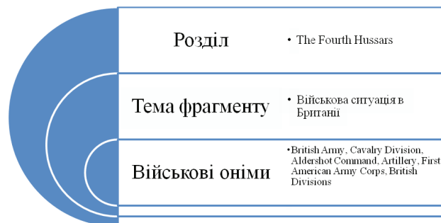
Рис. 2 Текстотвірне гніздо військових онімів без фонові інформації

а) Текстотвірне гніздо військових онімів за відсутності фонові інформації (див. рис. 2):