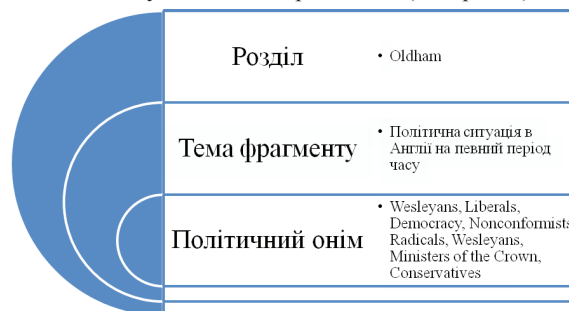
Рис. 1. Текстотвірне гніздо на основі політичних онімів

– Виконання ролі мікротеми або частини мікротеми політичним онімом, або продукування власного вербального гнізда. Мікротемою даного фрагменту мемуарів є політична ситуація в Англії в певний період часу. Усі політичні оніми даного уривку є наноелементами побудови концептуальної картини всього фрагменту. Кожна ВН допомагає сконструювати ідейну структуру фрагменту твору, що породжується, базуючись на власному досвіді автора та на загальній політичній ситуації в країні, утворюючи, тим самим, наступне текстотвірне гніздо (див. рис. 1):