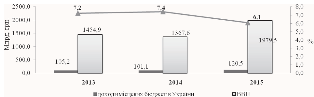
Рис. 1.2. Динаміка зміни частки доходів місцевих бюджетів України у ВВП за 2013-2015 роки

Також одним із найбільш важливіших показників, які характеризують фінансову політику в державі та рівень її децентралізації є ВВП. Валовий внутрішній продукт досить тісно зв'язаний доходами держави, тому проаналізуємо, яку частку у ВВП займають доходи місцевих бюджетів України та визначимо ступінь децентралізації його (рис. 1.2.).