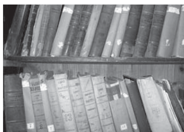
Figura 2. Almacenamiento de la documentación en el archivo.

Afectaciones en los documentos: existencia de documentos con desgaste, perforación, oxidación, manchas, arrugas y/o dobleces, etc. Falta de detectores contra incendios. Falta de instrumentos de medición como luxómetros, termómetros, sicrometro entre otros. Para el diagnóstico del fondo se utilizaron los inventarios realizados para el museo municipal y para la propia institución. Se tomaron como muestra todos los documentos que atesora el archivo por no