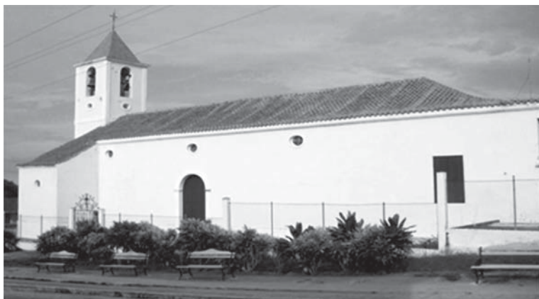
Figura 1. Vista lateral de la Iglesia Católica “San Pedro y San Pablo” de Corralillo.

El archivo se encuentra enclavado en el poblado de Corralillo de la Provincia de Villa Clara. La institución está localizada dentro de la Casa Parroquial de la Iglesia Católica “San Pedro y San Pablo”. La iglesia se encuentra ubicada en el centro de la manzana que rodean las calles Leoncio Vidal, Libertad, Rafael Izquierdo y Máximo Gómez. La edificación es considerada Patrimonio Local, posee una estructura de planta rectangular, presenta una sola puerta en su fachada principal la cual está presidida por tres arcos de medio punto de alto puntal en sus caras exteriores que soportan la torre, a la cual le siguen dos cuerpos cúbicos de forma decreciente y termina en una cupulilla de forma piramidal. La cubierta es de tejas criollas sobre un afaldaje de madera a dos aguas. Los muros son de mampostería utilizando fundamentalmente la piedra, el ladrillo y el cocó como material aglomerante. En el piso se utilizó el mosaico mezclado con el hormigón natural. La construcción data de la segunda mitad del siglo XIX. Fue inaugurada en febrero de 1853. Mantiene buen estado constructivo y sin peligro de derrumbe.