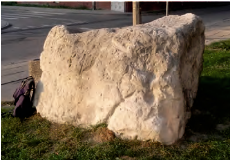
Fot. 6. Drugim pod względem wielkości głazem Pruszkowa jest piaskowiec o lepiszczu węglanowym z zachowanymi nielicznymi skamieniałościami, zdołający skwer przed budynkiem ZUS-u przy ul. Stalowej 25

Kolejnym, jak się okazuje (tab. 1) trzecim pod względem wielkości głazem Pruszkowa jest ten, znajdujący się po południowej stronie ulicy Wojska Polskiego na wysokości bloku nr 3 przy ul. Lalki na Os. Prusa (fot. 7). Jest to granit, pochodzący prawdopodobnie z południowo-wschodniej Szwecji. W jego wyglądzie zewnętrznym zwraca uwagę dobre wygładzenie wszelkich krawędzi i wyniosłości, co jest efektem korazji (to jest szlifowania wystających elementów skały przez strumienie wiatrowo-piaszczysto-śnieżne). Głaz jest częściowo zakotwiczony w podłożu. Jego górna, wystająca część, ma następujące wymiary: długość 2,15 m, szerokość 1,3 m, wysokość 1,0 m, obwód 5,6 m, objętość 1,46 m 3 , szacowana waga 4 t.