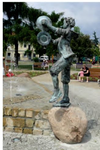
Fot. 9. Petrograficzny detal fontanny w Parku Sokoła