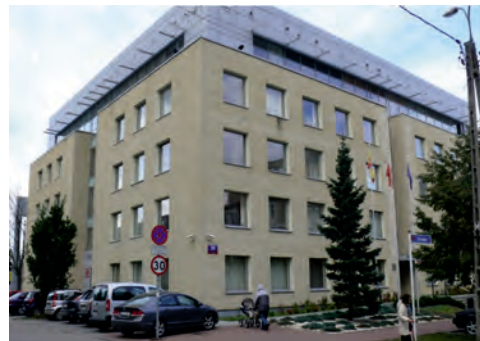
Fot. 13. Elewację budynku Starostwa Powiatowego zdobi cegielka Novabrik, będąca mieszanką kruszyw naturalnych (granitu, marmuru, miki) fot. M. Górską-Zabielska (2015)