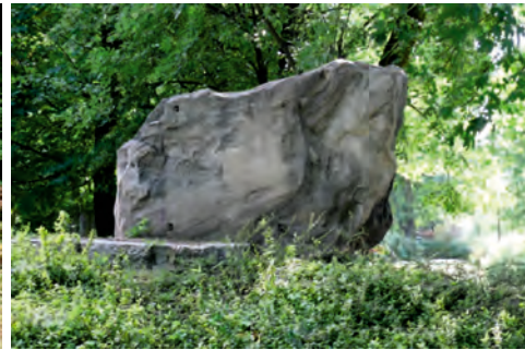
Fot. 5. Czwarty pod względem wielkości głaz narzutowy Pruszkowa – piaskowiec; na bocznej ścianie doskonale widoczne warstwowanie skały oraz nieodwracalne zniszczenia w postaci śladów po otworach, w które najprawdopodobniej wkręcono śruby mocujące płytę