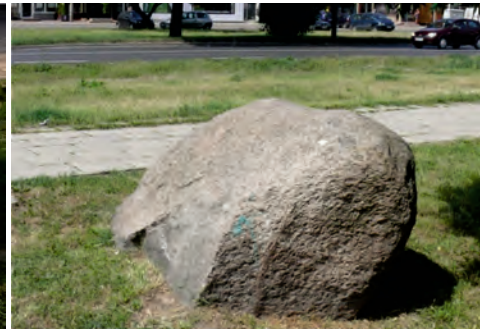
Fot. 7. Eolizowany granit różowy znajdujący się w pobliżu bloku nr 3 przy ul. Lalki na Os. Prusa; trzeci pod względem wielkości głaz narzutowy w Pruszkowie