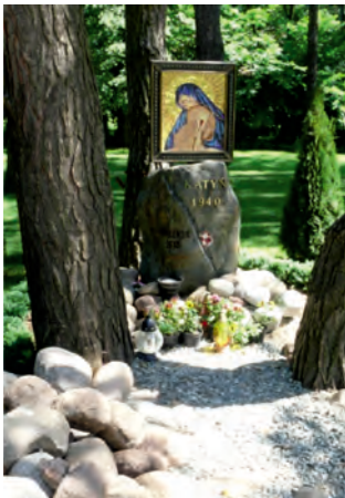
Fot. 12. Symboliczny głaz upamiętniający dwie narodowe tragedie: tę sprzed 70 laty w Katyniu, i tę z kwietnia 2010 roku