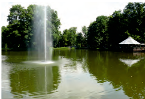
Fot. 3. Największy z czterech stawów w Parku Potulickich z nowym nabytkiem w postaci fontanny