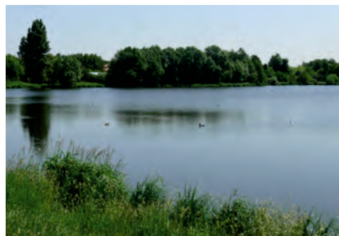
Fot. 2. Zalew Komorowski – ulubione miejsce spacerów okolicznych mieszkańców