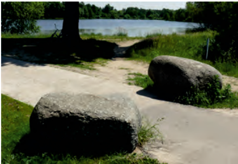
Fot. 10. Dwa granity blokują wjazd dużych pojazdów na teren ścieżki wokół Zalewu Komorowskiego fot. M. Górską-Zabielska (2011)