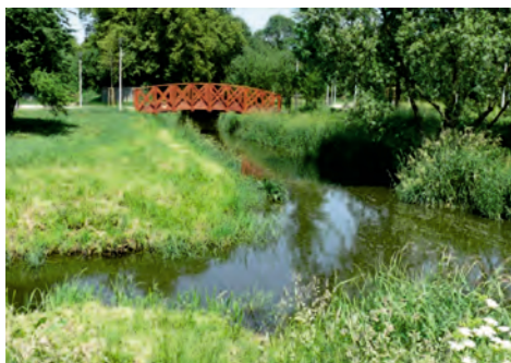
Fot. 1. Omawiany teren odwadniany jest przez rzekę Utratę; na zdjęciu rzeka po opuszczeniu Zalewu Komorowskiego

walor krajobrazowy wraz z pałacem został dość wcześnie doceniony i objęty już w 1963 roku ochroną konserwatorską poprzez wpisanie do Rejestru Zabytków. Wszystkie te obiekty powstały dzięki dogodnemu naturalnemu ukształtowaniu terenu oraz zaadoptowaniu starorzeczy Utraty i wyrobisk pocegielnianych (Bielawski 2009).