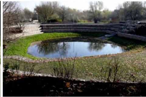
Fot. 11. Gabiony – ozdobne umocnienia (zbudowane z otaczaków skandynawskich narzutniaków) zboczy tzw. „Dołów”, czyli dawnych glinianek hr. Potulickiego – wyrobisk eksploatacyjnych iłów neogeńskich w pld. części Pruszkowa fot. M. Górską-Zabielska (2015)