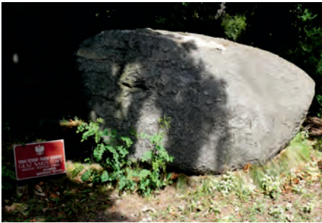
Fot. 4. Największy głaz narzutowy w Pruszkowie, znajdujący się tuż za ogrodzeniem Muzeum Starożytnego Hutnictwa Mazowieckiego; jest to jedyny w Pruszkowie pomnik przyrody nieożywionej

Obok, na niewielkim wzniesieniu, znajduje się inny duży głaz narzutowy miasta (nr 4 w tab. 1). Tym razem jest to piaskowiec, przykład skały osadowej okruczowej, powstającej przez scementowanie drobnych luźnych ziaren piasku. Dzieje się to wraz z upływem czasu i pod wpływem nacisku skał nadległych. Na ścianie bocznej głazu doskonale widoczne jest pierwotne warstwowanie luźnego osadu (fot. 5). Powstaje ono podczas depozycji ziaren piasku na dnie zbiorników wodnych (mórz, jezior). Piasek może też być odkładany w warunkach pustynnych. Takiej jednak depozycji towarzyszy inne warstwowanie i z reguły inna barwa minerałów. Wymiary omawianego piaskowca to: długość 2,65 m, szerokość 0,55 m, wysokość 1,85 m, obwód 5,85 m, objętość 1,4 m 3 , szacowana waga 3,9 t. Zanim głaz znalazł się na obecnym miejscu, musiał przez dłuższy czas podlegać niszczącemu oddziaływaniu strumieni wiatrowo-piaszczystych(-śnieżnych?), wiejących z jednego kierunku. W miejscu, gdzie został zdeponowany przez ładólód skandynawski podlegał zatem korozji, co dziś przejawia się eolizacją (wygładzeniem; gr. Aiolos – mityczny władca wiatrów) powierzchni ścian bocznych. Na głazie widać ponadto antropogeniczne zniszczenia w postaci otworów po śrubach przytrzymujących prawdopodobnie tablicę pamiątkową.