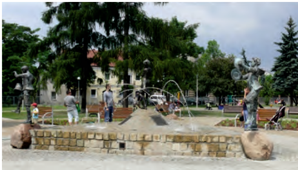
Fot. 8. W południowej części Parku Sokoła, w cokole fontanny, umieszczono w celach dekoracyjnych trzy średniej wielkości głady narzutowe