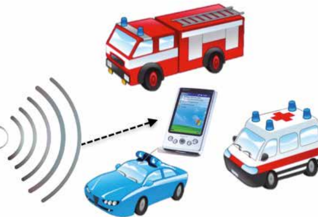
4. Caso B: informazioni acquisite in prossimità della galleria