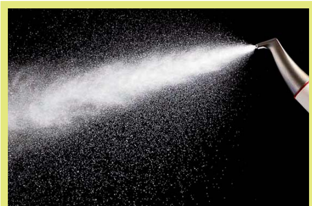
2. ábra: Air-flow készülék (16)