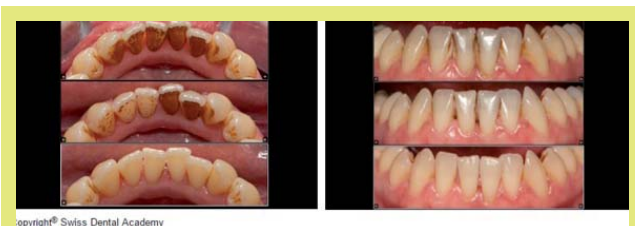
4 ábra: Tisztítás air-flow rendszerrel (18)

illeszkedik a pótlás. Aerob Gram-negatív bacilusokat fedeztek fel fogműveket viselő páciensek nyálában, és az S. aureus is megszállhatja a fogműveket. A fix pótlásoknál az anyaguk a döntő jelentőségű a plakk kialakulása szempontjából, hiszen a tiszta fém pótlásokon nem tapad meg a biofilm, de a műanyag pótlások fokozottabb veszélynek vannak kitéve.