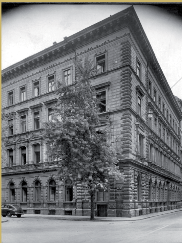
4. ábra: Központi Stomatológiai Intézet

önálló felsőoktatási intézménynek a megalakulása – a Pázmány Péter Tudományegyetemnek 1950-ben előbb Eötvös Lóránd Tudományegyetemmé történő átnevezése, majd azt követő feldarabolása után – a 27/1951. (I. 28.) sz. minisztertanácsi rendelet alapján történt (7). Már ezt megelőzően a Vallás- és Közoktatási Minisztérium (VKM) 20.534/1947 VI/a (II. 8.) sz. rendelete alapján a fogászat (!) egy féleven át heti öt órában az orvostanhallgatók számára kötelezően felveendő tárggyá vált. Az orvoskarok számára kiadott, a végbizonyítvány megszerzésének feltételeit felsoroló tanulmányi és szigorlati rend azonban a stomatológia sikeres kollokviummal történő lezárását írja elő.