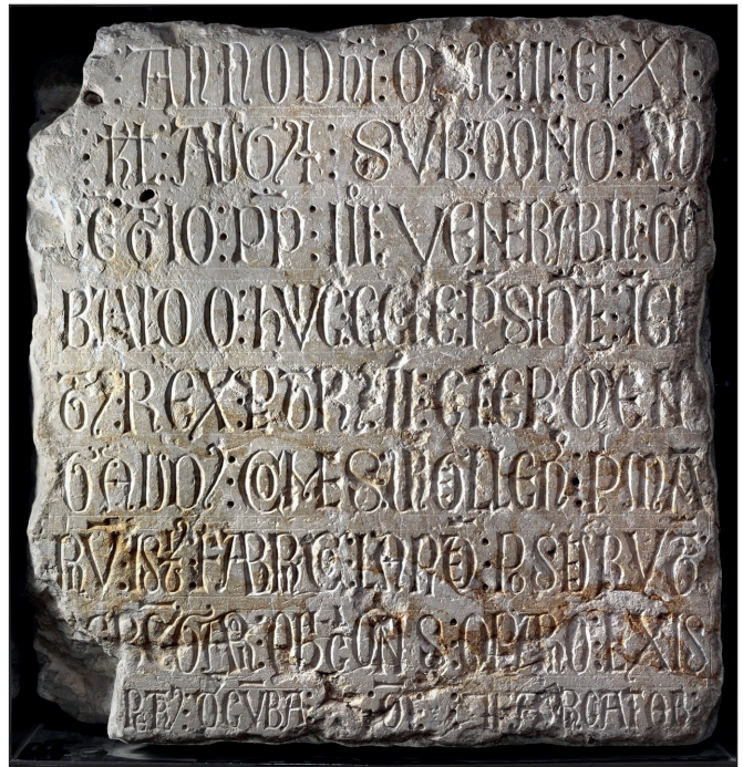
Fig. 1 Commemoració epigràfica de l'inici oficial de les obres de la catedral de Santa Maria de Lleida. Mur nord del presbiteri.

Aquesta funció podia ser exercitada per un monjo en els monestirs o bé per un canonge a les col·legiades o catedrals, o fins i tot per un laic professional. Aquest darrer és precisament el perfil de l'arquitecte Ramon Lambard ( Raimundus Lambardus ), contractat l'any 1175 per a la conclusió de la catedral de la Seu d'Urgell. En el contracte signat entre el bisbe i el capítol de la Seu d'Urgell per a la finalització de les obres de la catedral de Santa Maria (doc.1.), es confirma la seva doble funció com a mestre d'obres, però també com a obrer catedralici responsable de la gestió financera de la construcció. Com han suggerit altres autors, probablement Ramon Lambard, oriünd de la vila de Coll de Nargó, hauria rebut aquest encàrrec gràcies als seus contactes amb el capítol catedralici, on es documenta un Pere de Nargó,