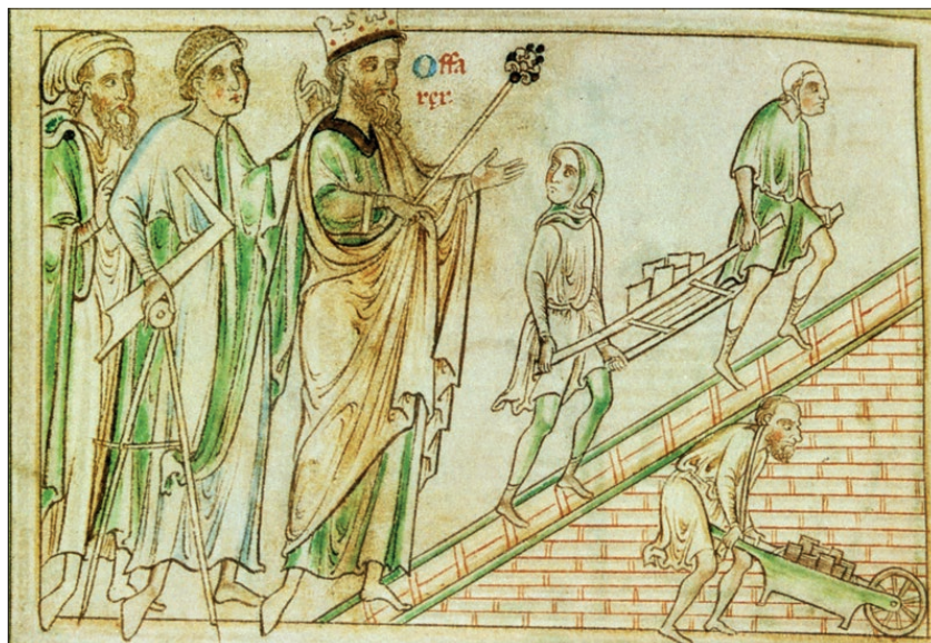
Fig. 5 (esq.) Miniatura de la Relatio de innovatione ecclesiae Sancti Geminiani , amb els «artifices» i els «operaris» sota les ordres de Lanfranco. Modena, Archivio capitolare, Ms.O.II.11, f. 9r. Segle XIII.