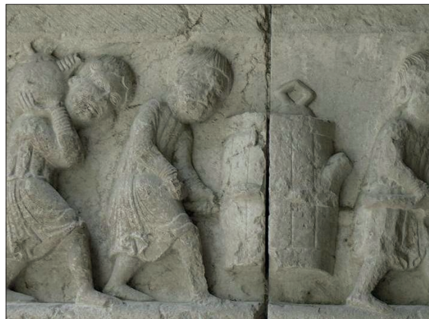
Fig. 13 (esq.) Catedral de Girona, claustre. Operaris transportant aigua (darrer quart del segle XII).