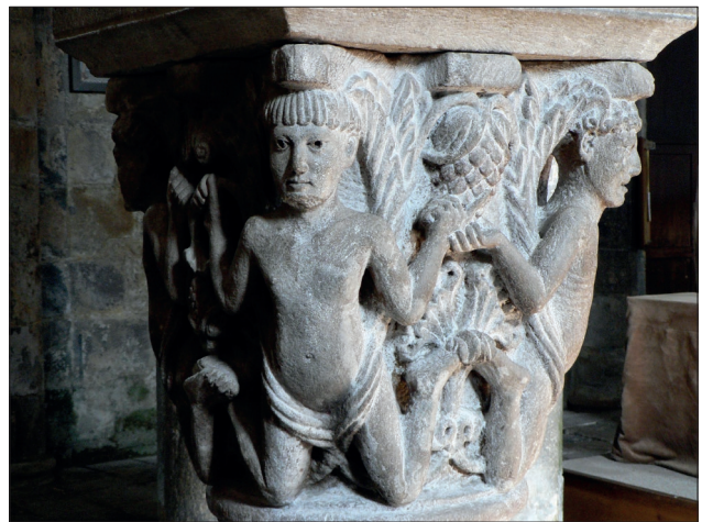
Fig. 9 Capitell amb atlants conservats a Saint-Pierre de Mozac (Puy-de-Dôme).

Sant Pere de la Madrona, avui al Museu Diocesà i Comarcal de Solsona (fig.8) 36 . El primer capitell (inv.157) és decorat amb un personatge barbat i vestit amb una túnica cenyida a la cintura que deixa veure els seus peus nusos, recolzats sobre l'astràgal. Presenta una corona a la testa, de la qual emergeixen unes tiges sostingudes pel personatge i que més tard s'enrosquen als seus braços. Sens dubte, l'element de major interès és la inscripció de l'àbac, ja reproduïda per Joan Serra Vilaró, que identificà Mirus com l'arquitecte de l'edifici. Poc després Puig i Cadafalch es feia ressò de la inscripció tot afirmant que la figura representada al tambor era el retrat de "l'autor de obra" 37 , mentre que per altres podria tractar-se d'una cariàtide 38 , o d'un atlant 39 .