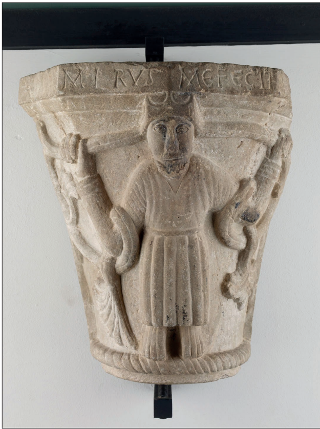
Fig. 8 Capitell procedent de la cripta de Sant Pere de Mardona, conservat al Museu Diocesà i Comarcal de Solsona ©. Segle XII.

dell va dirigir un taller itinerant especialitzat en la construcció de claustres que no només assumí la decoració escultòrica dels claustres de Girona i Sant Cugat, sino també de les parts estructurals. Precisament és aquest perfil que els darrers anys Manuel Castiñeiras ha plantejat per la figura del Maestro Mateo, un director d'obres que entre 1168 i 1188/1211 va dur terme la finalització del cos occidental de la catedral de Santiago i va enllestir l'edifici per la consagració del 1211 33 .