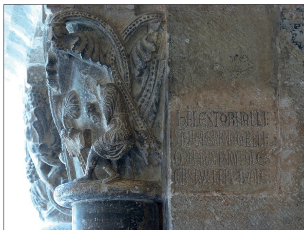
Fig. 7 Inscripció encastada al pilar nord-oriental del claustre de Sant Cugat. Adossat a l'esmentat pilar trobem la representació d'un escultor tallant un capitell corinti, escena que ha estat identificada com l'autoretrat de l'escultor: Foto: J.A.. Olañeta

pàs. La seva situació entre el rei i l'administrador, i fins i tot la gestualitat, anunciant al monarca l'estat dels treballs, es reveladora del pujant estatus social de l'arquitecte. La seva figura s'engrandí de manera que fins i tot algunes inscripcions el presenten com magister doctissimus, doctissimus in arte o nobiliter doctus in arte . N'és un exemple la làpida encastada al mur exterior de l'absis major de la catedral de Mòdena, que commemora la direcció del propi Lanfranco amb uns termes prou eloqüents: « Ingenio clarus Lanfrancus doctus et aptus, est operis princeps rectorque magister » (Lanfranco, mestre de clar enginy [...] docte i apte [...] és el creador i mestre rector d'aquesta obra).