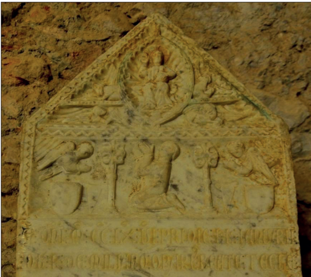
Fig. 2 Lauda sepulcral del canonge Ramon de Milà, marbre. Vers l'any 1266.

Segons les condicions del contracte, Pere de Coma assumia la direcció de les obres de la catedral renunciant a tots els seus béns i pertinences, que consistien en 6 sous censals que rebia d'una honor situada a la torre de Grealo i la seva casa ubicada a la parròquia de Sant Joan, essent admès a la canonja 13 . A diferència de Ramon Lambard, que rebé una pensió de per vida equivalent a una porció canonical –concretada en la manutenció, vestit, emoluments i béns de l'obra– però no ingressa a la comunitat, Pere de Coma s'entrega, en persona i béns, a l'obra de la Seu de Lleida. Es tracta, per tant, d'un conversus , que rebrà, com un canonge més, la seva porció canonical i 50 sous anuals per a vestimenta 14 .