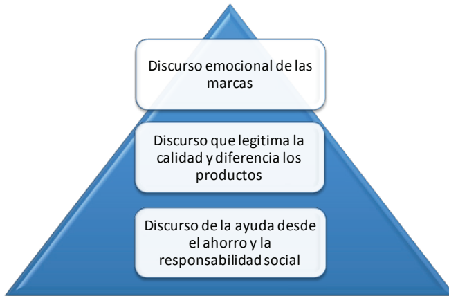
Figura 4. Principales ejes discursivos.

Aún así, cuando el discurso se centra en la ayuda y adaptación al consumidor para superar la crisis se utiliza ya un tipo de comunicación más personal, simbólica y que busca la empatía con sus consumidores.