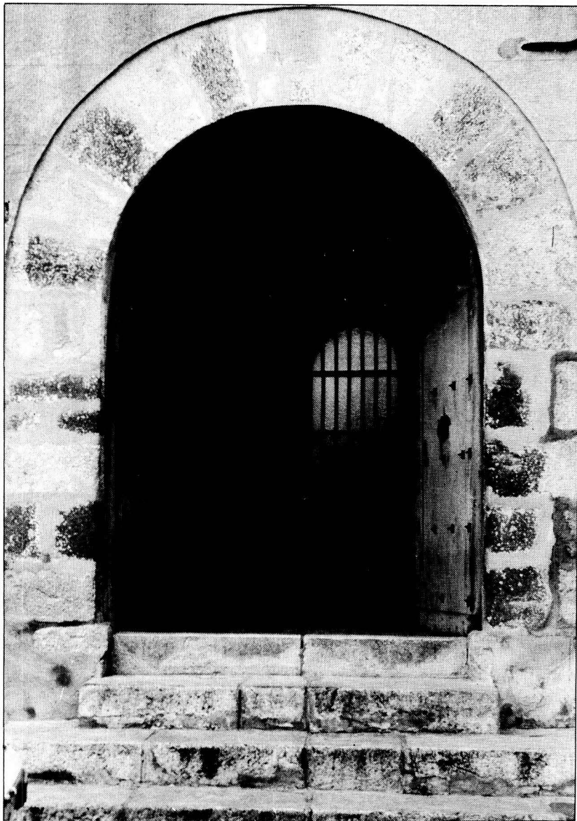
El ritual públic de l'ofrena tenia lloc a la plaça de l'Església, davant de l'abadia o rectoria