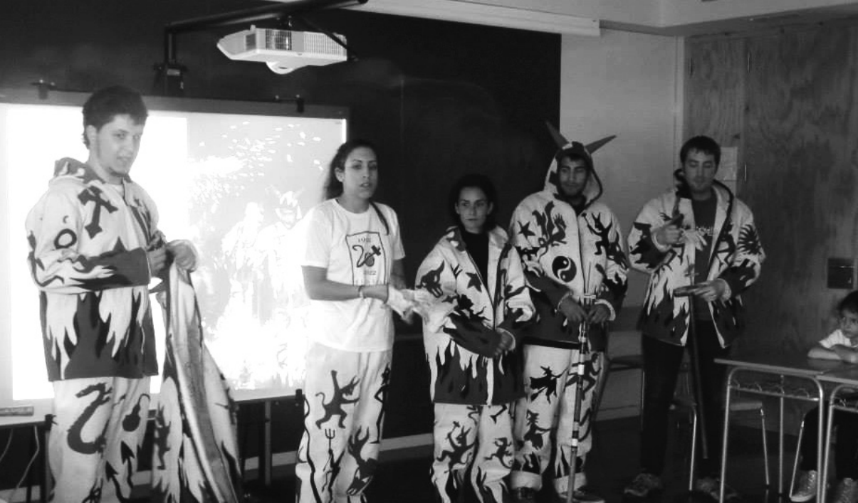
Membres de la Colla de Diables del CERAP explicant als alumnes de l'Escola Cavaller Arnau el funcionament de la colla.

aplega els Diables d'aquesta zona. Cal remarcar i admirar el treball d'aquesta jove colla de Diables que, tot i no tenir gaire suport de les institucions, treballa any rere any perquè la nostra cultura i les nostres tradicions siguin presents a tota la capital del tarragonès més enllà de les seves muralles. Aquesta trobada va aplegar, a més dels amfitrions, les Colles de Diables de Montblanc, el Ball de Diables de Vila-seca i la nostra colla, que sortint de la Torre Forta (una antiga torre de guaita del segle XVII que dona nom al barri) vam portar el foc i els ritmes infernals per tots els carrers del recorregut. La trobada, en el marc de la Festa Major de Torreforta, va continuar amb un sopar de germanor i un concert. Esperem retrobar-nos ben aviat amb els companys de la Colla Foc i Gresca! »