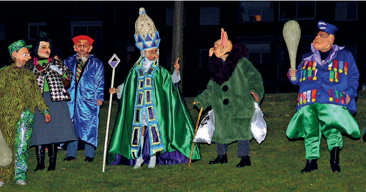
Figura 22. Els poders, 2012. Font: Daniel Valero