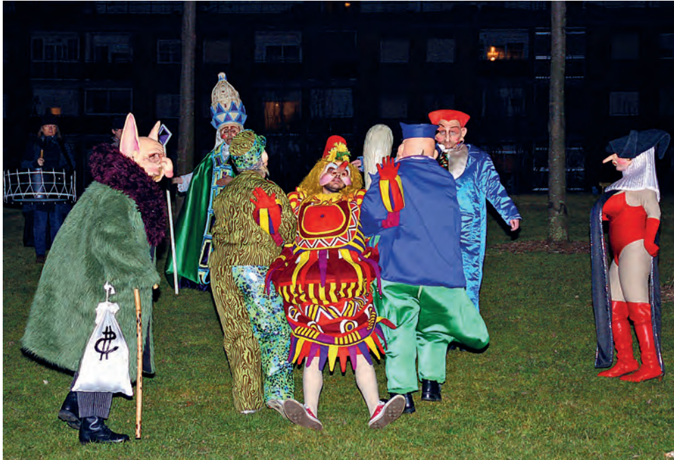
Figura 13. El Calollu i el Caudillo s'emporten el Carnestoltes a cremar, després que la Papessa l'ha condemnat a la foguera, 2012.