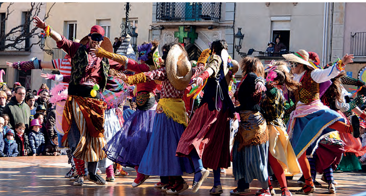
Figura 6. Ball del barraló a l'arribada d'en Carnestoltes a la pl. Prat de la Riba, amb l'Esbart Dansaire de Mollet, 2012.

avis fan un taller de confecció de sardines amb els infants i després aquests van en processó a enterrar-les. La comitiva, presidida per una banda, una gran sardina feta per Galiot Teatre, alguns dels personatges de la comparsa de la Quaresma i una colla de vídues desconsolades, marxa fins al sorral de la plaça de l'Artesania per enterrar les sardines i cloure, d'aquesta manera, el Carnaval. Aquesta activitat es passa a fer, l'any següent, amb els avis i les àvies de Mollet, com un acte intergeneracional, amb l'acompanyament de Galiot Teatre, que presidia, amb un carro, la comitiva fúnebre de la qual formaven part els poders. L'acte es tancava amb xocolatada popular algunes vegades o bé amb sardinada oferta pels paradistes del Mercat i l'AV de la Fira d'Artesans, les altres. L'enterrament de la sardina va tenir continuïtat fins a l'any 2011.