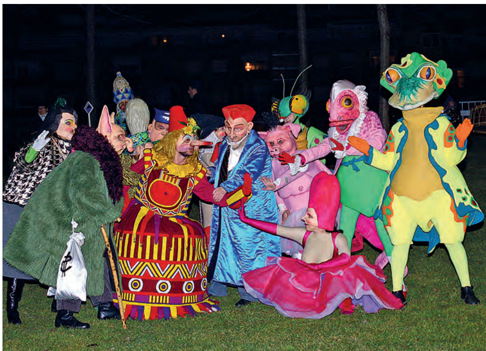
Figura 12. Els poders volen prendre Carnestoltes, i els seus amics el defensen, 2012.