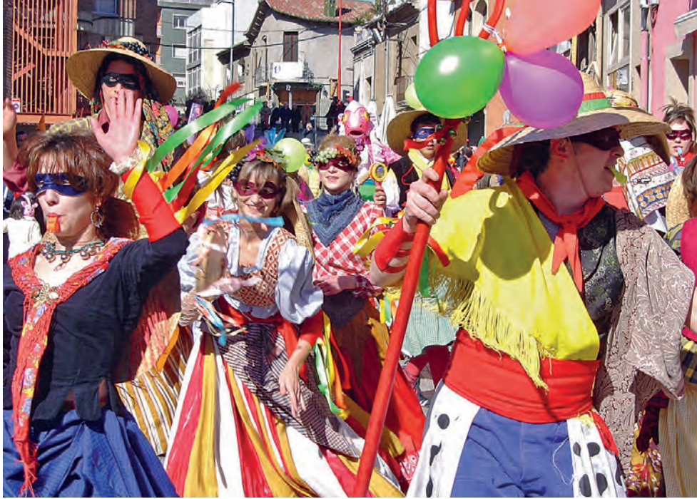
196 Figura 8. Cercavila d'entrada a la pl. Prat de la Riba, ballada per l'Esbart Dansaire de Mollet, 2006.

Aquesta concentració de tabalers, amb capes i barrets negres acompanyant el Carnestoltes a la pira juntament amb els Diables, li dona molta espectacularitat a l'escena. La imatge del penjat i d'execució pública, que no agradava a l'equip de Cultura, es torna a mostrar. Els textos del pregó i el guió els escriu Esteve Plantada. L'espai escènic es treballa amb tarima, a peu pla i solament s'utilitza el turó per a la crema. L'exploració d'aquest espai escènic s'aprofundirà més endavant, a partir de 2011. Amb Txell Roda, el domàs de colors que guarneix el balcó de l'antic Ajuntament de la plaça de Prat de la Riba es decora amb roba interior per rebre el Carnestoltes, els personatges surten al carrer a trobar-se amb la gent abans de l'arribada, els assajos es fan a l'antiga Serradora i, el més important, es consolida un grup de gent jove a