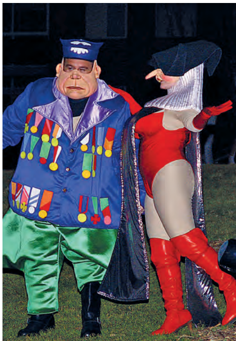
Figura 24. En Caudalillo i la Pepa en el judici, 2012.

control. No vol que la gent s'ho passi bé. Rígid i robust, fa por o fa pena, però ell vol dominar i ser temut. Es relaciona autoritàriament amb els altres per por de fer el ridícul. Vol controlar i eliminar en Carnestoltes. Sempre es pensa que té la raó i la solució per a tot. Vol tenir molt de poder, semblar molt dur, sempre parla donant ordres i no vol que li portin la contrària. Ell i el Calollu són els encarregats de prendre el Carnestoltes.