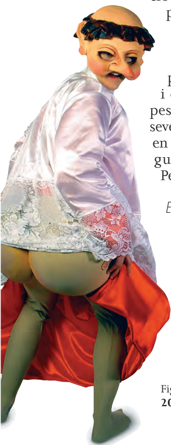
Figura 27. El Pere de la Cullera, 2010.

El ball del barraló és un ball que es ballava al Tabaran, on els homes es disfressaven de dones i les dones podien triar la seva parella. L'any 2004 es recuperà aquest ball i des d'aleshores es demana al públic que duguin barret per a l'arribada d'en Carnestoltes a la ciutat.