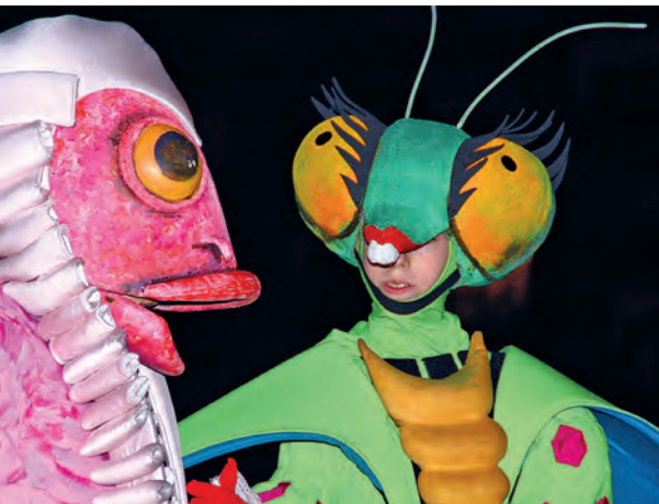
Figura 18. El Moll i l'Amantis, 2012.