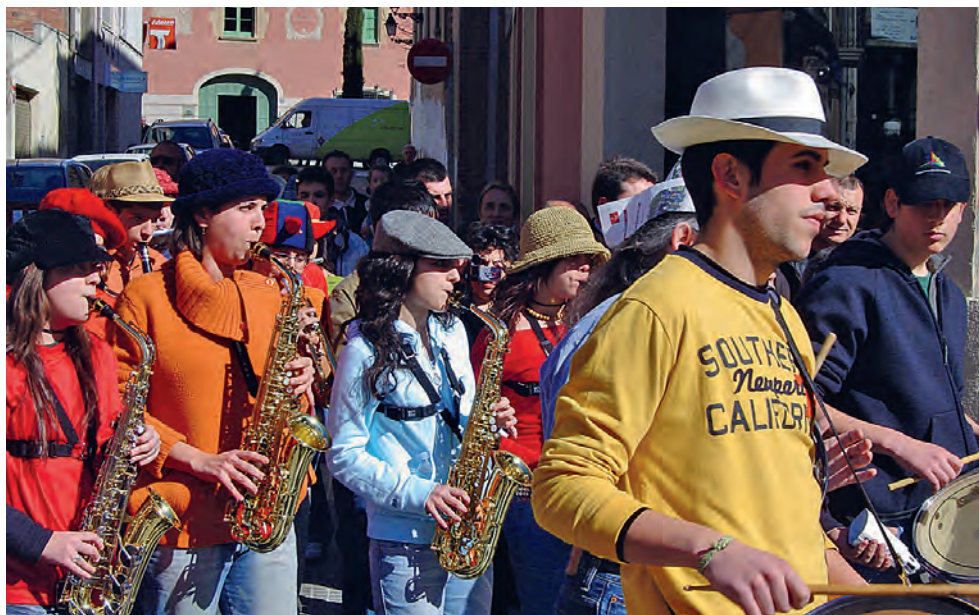
Figura 15. La Jazz Band de Mollet a la cercavila de l'arribada del Carnestoltes, 2006.