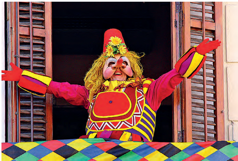
Figura 11. Carnestoltes pren el poder sortint al balcó de l'antic Ajuntament el dia de l'arribada, 2012.