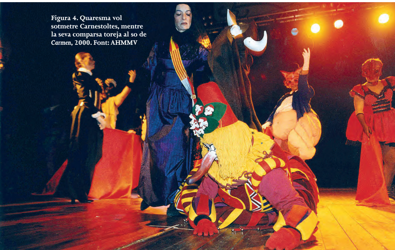
Figura 4. Quaresma vol sotmetre Carnestoltes, mentre la seva comparsa toreja al so de Carmen, 2000.