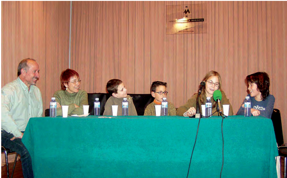
Figura 5. Carnestoltades a La Marineta. Nens i nenes parlant de Carnaval, 2004. Font: Carme Miró