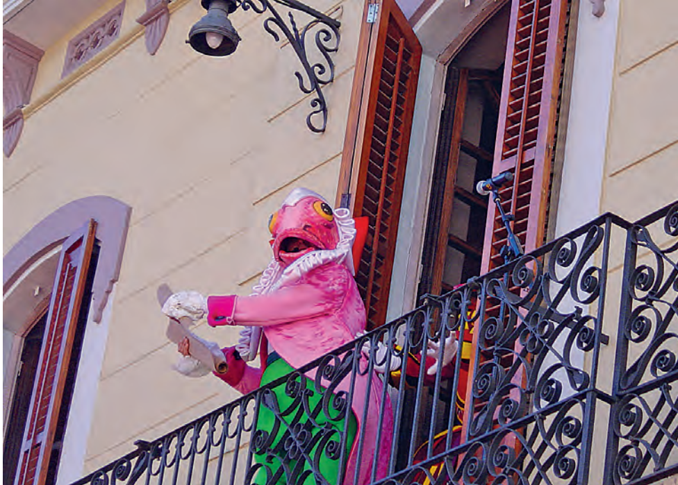
200 Figura 10. El Moll sempre fa el pregó del Carnestoltes al balcó de l'antic Ajuntament, parlant en nom seu, 2006.

baix amb l'Esbart, que torna a ballar. Amb el Carnestoltes al balcó, el Moll, que parla en representació del Rei del Carnaval, fa el pregó, i tot seguit es fa el ball del barraló, que cada vegada sap ballar més gent. Una dansaire de l'Esbart l'ensenya a ballar al públic, que aquell dia porta barret per rebre el Carnestoltes. La plaça està a vessar de famílies amb infants i públic en general que van a veure com arriba. És una escenificació molt festiva i alegre.