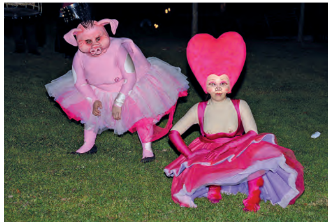
Figura 19. La Cor i la Porqueta, les dues coquetes roses de la comparsa d'en Carnestoltes, una dolça i l'altra provocativa, 2012.