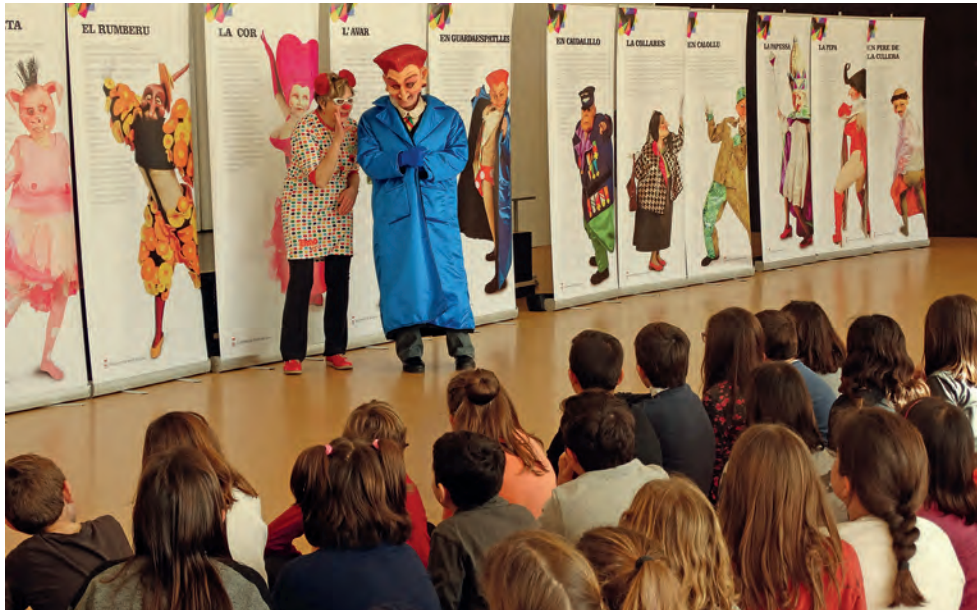
Figura 26. El Guardaespatlles a l'escola de Cal Músic, acompanyant l'exposició, 2016