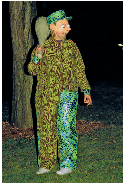
Figura 25. En Calollu en el judici, 2012.

Li diuen Maria de los Collares i està casada amb el Caudalillo. Vol que tothom vegi com és d'important el seu marit. No vol que li prenguin el