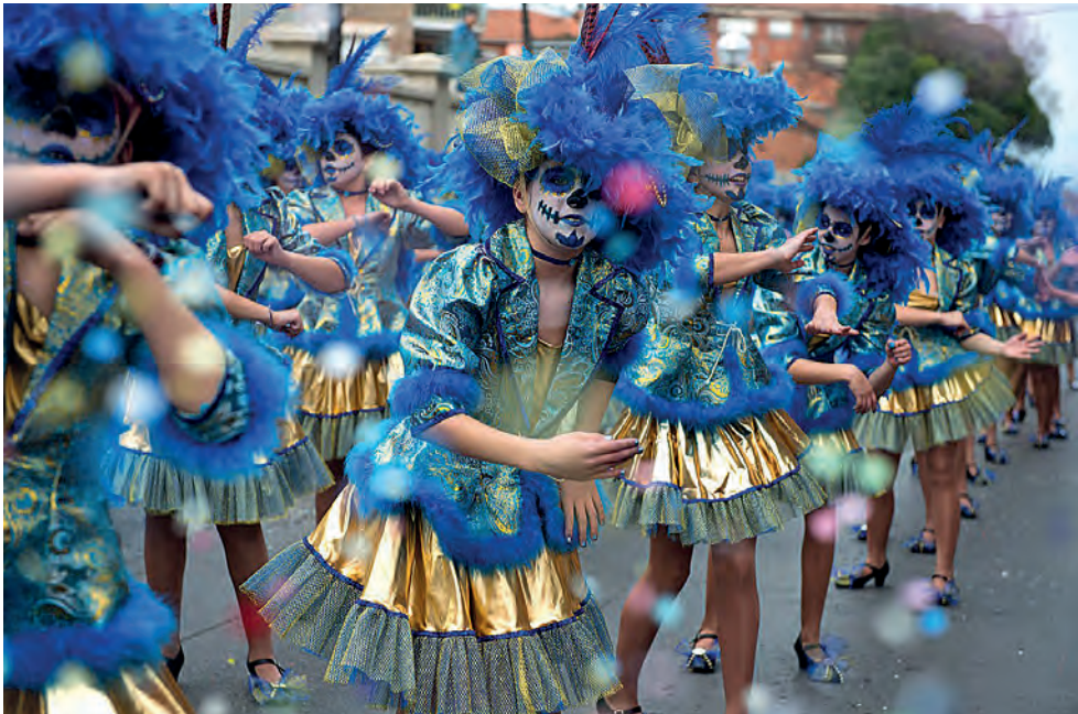
Figura 29. Comparsa de l'AV de Santa Rosa, guanyadora de la rua de 2014.