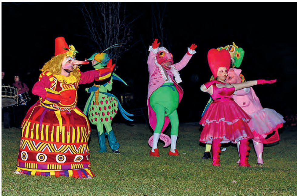
Figura 17. El Carnestoltes en el judici, 2012.

És el fidel acompanyant d'en Carnestoltes, el seu mestre de cerimònies i de protocol. És qui parla per boca d'en Carnestoltes a tothom,