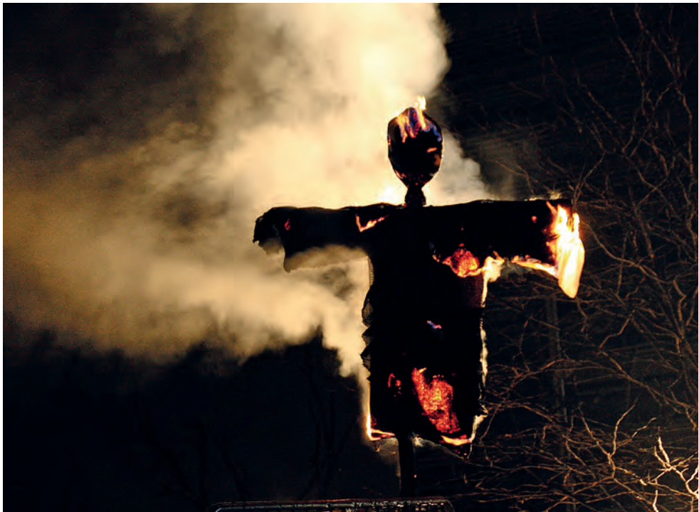
Figura 14. Crema de Carnestoltes, 2012.