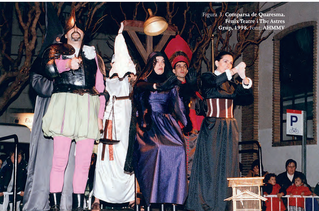
Figura 3. Comparsa de Quaresma. Fènix Teatre i The Astres Grup, 1998.