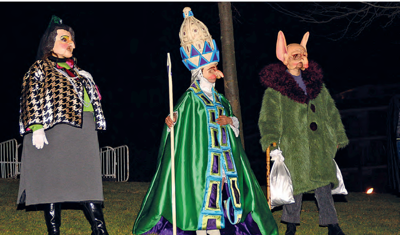
Figura 23. La Collares, la Papessa i l'Avar en el judici, 2012.