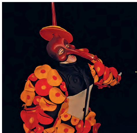
Figura 21. El Rumbero en el judici del Carnestoltes, 2013.

Li diuen Caudalillo Salmonete de los Valles. Encarna l'estament militar, el patriotisme més ranci i l'esperit bèl·lic. Té la necessitat de defensar el propi territori i de retornar el cop rebut amb un de més fort. Vol manar, governar el país i tenir-ho tot sota