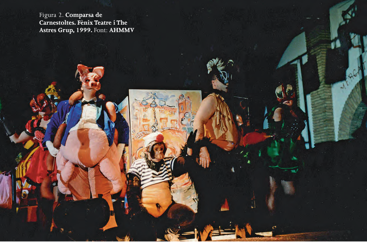
Figura 2. Comparsa de Carnestoltes. Fènix Teatre i The Astres Grup, 1999.

viment amb el qual penetra en l'ordre i el sacseja, trenca les vestidures de la moral i li deixa als peus el repte de la seducció.