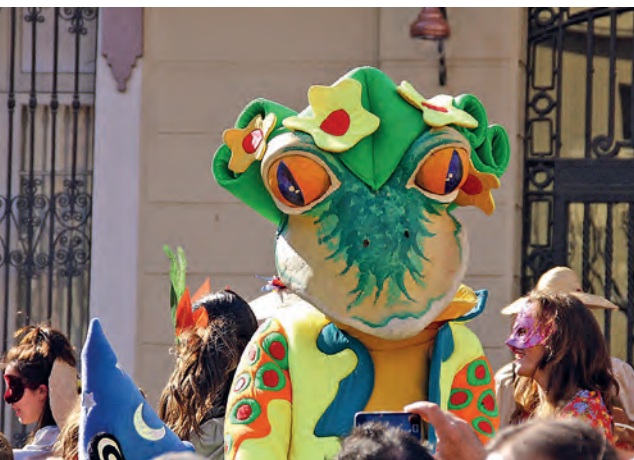
Figura 20. La Granota sempre es deixa retratar, 2012.

Forma part de la comparsa d'en Carnestoltes. És juganera i saltirona. Té bona relació amb tothom; és molt cordial. No vol que la trepitgin; és una mica poruga. Com que és bona, a vegades els altres se n'aprofiten. Li agrada menjar mosques. Vol una bona bassa per saltar i ballar. No vol calma. Necessita marxa, perquè durant tot l'any s'avorreix molt a la seva bassa de Gallecs esperant el Carnaval.