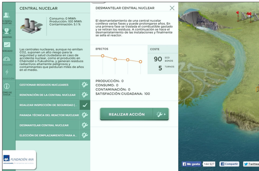
Fig. 2. Acción «desmantelar central nuclear» en My Green Planet

El tono alarmista de algunos mensajes va acompañado de tonos proactivos y esperanzadores. Además, algunos de estos juegos enmarcan el mensaje en la solidaridad y la justicia. Igualmente, en estos juegos no cabe duda de la influencia de las actividades humanas en el cambio climático debido a la incontrolada emisión de gases de efecto invernadero a la atmósfera, especialmente CO 2 (figura 3). Algunas de las consecuencias para el medio ambiente y la sociedad se hacen visibles de manera clara y visual en estos juegos.