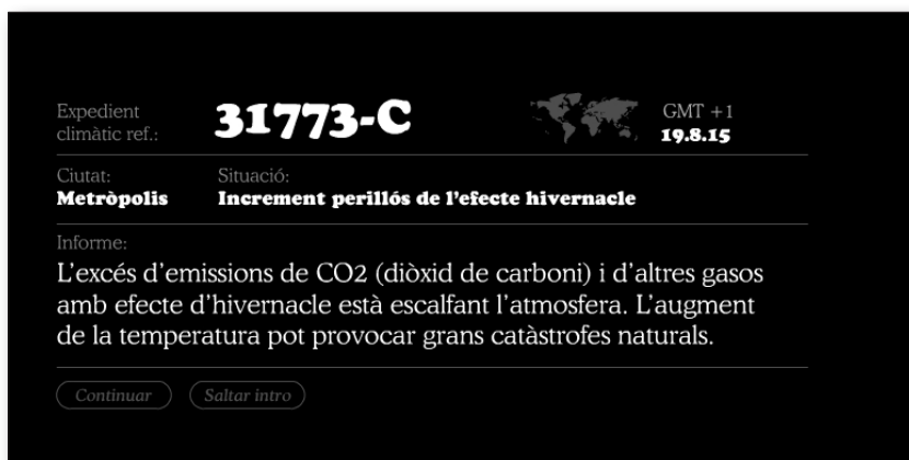
Fig. 3. Explicación de las causas en Alerta CO 2 .

El tono alarmista de algunos mensajes va acompañado de tonos proactivos y esperanzadores. Además, algunos de estos juegos enmarcan el mensaje en la solidaridad y la justicia. Igualmente, en estos juegos no cabe duda de la influencia de las actividades humanas en el cambio climático debido a la incontrolada emisión de gases de efecto invernadero a la atmósfera, especialmente CO 2 (figura 3). Algunas de las consecuencias para el medio ambiente y la sociedad se hacen visibles de manera clara y visual en estos juegos.