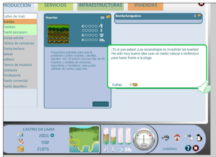
Fig. 4. Elogio tras una buena decisión en Climántica .

En la dimensión jugabilidad (tabla 5), es de destacar la prevalencia del descubrimiento y desafío en las dinámicas de los juegos a través de la toma de decisiones y presión de tiempo (figura 1). Las acciones que se contemplan vienen acompañadas de feedback (evaluación de las actuaciones y su impacto) y elogios (comentarios positivos) a través del discurso de los propios narradores de la historia o con notas explicativas que aparecen en pantalla (figura 4).