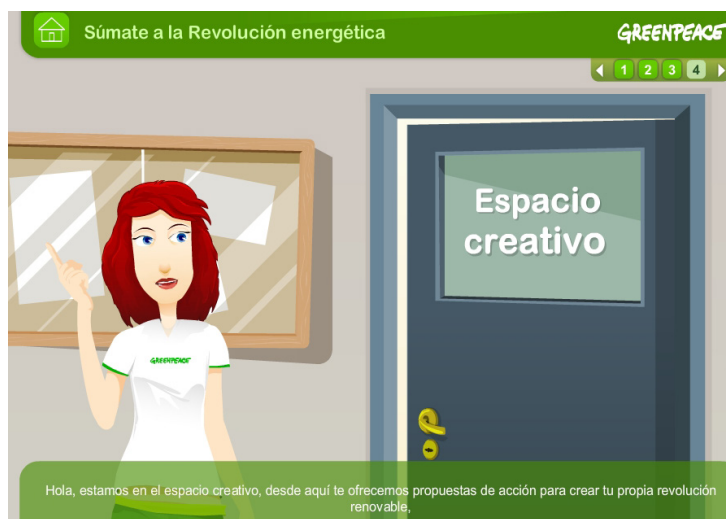
Fig. 6. Espacio creativo en Actúa con tu consumo .

Por último, los juegos evaluados presentan distintas curvas de aprendizaje, facilitan el desarrollo de la mayoría de las competencias recogidas por la LOMCE, incluida la competencia matemática en el caso de las simulaciones, y la adquisición de habilidades de pensamiento que establece la taxonomía de Bloom (1956), incluida la creatividad (figura 6). Como ejemplo, en Actúa con tu consumo , Eva anima a los jóvenes a escribir sus reflexiones sobre papel, a hacer encuestas a personas de su entorno y a realizar búsquedas de información por internet, asumiendo el papel de investigadores.