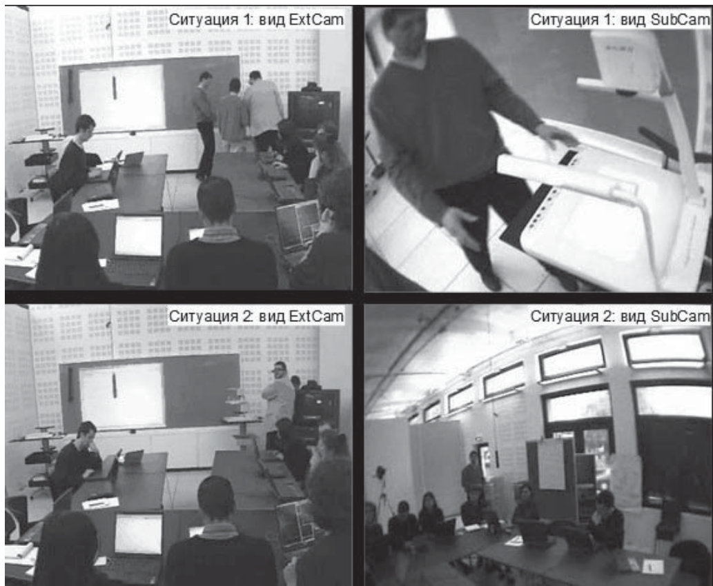
Рис. 17.1. Изображения двух ситуаций, снятых разными способами.

На изображениях справа – стоп-кадры записей, сделанных при помощи SubCam, которой экипирован субъект в светлом пиджаке. На изображениях слева (ExtCam) он находится около телевизионного экрана (Lahlou, Nosulenko, Samoilenko, 2012)