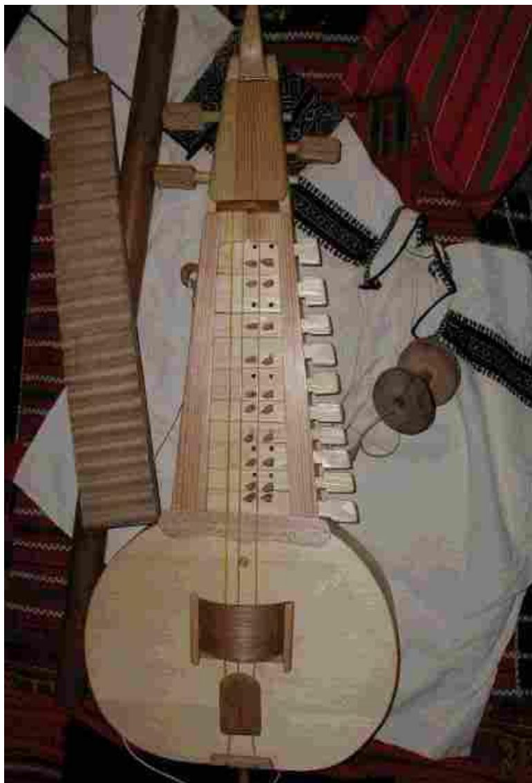
Рисунок 3. Гармонь.