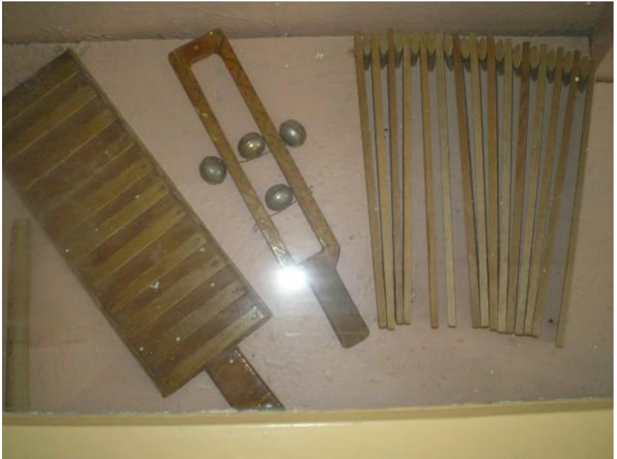
Рисунок 2. Донская лира.