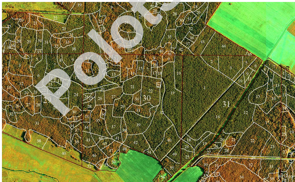
Рис. 1. Отдешифрированный цифровой аэрофотоснимок с камеры ADS-100, масштаб 1:10 000

Подготовленный для таксации снимок распечатывается на фотобумаге и выдается инженеру-таксатору для выхода в поле.