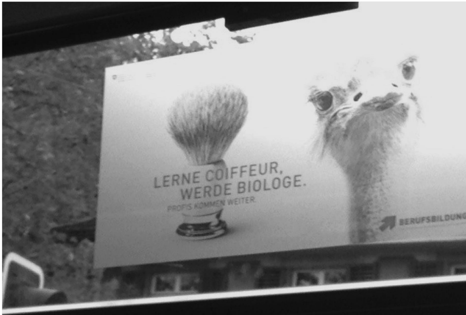
Abb. 2 Imagekampagne für die Berufsbildung in der Schweiz 2016 (Werbung in der Straßenbahn) (siehe auch Gonon 2016c)

Aufgrund dieser Ausgangslage ergeben sich im Wesentlichen drei Herausforderungen: