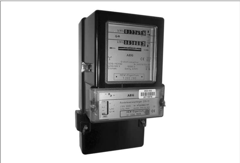
Abbildung 2: Zweitarifzähler mit Rundfunksteuerempfänger für Tag- und-Nacht-Tarif.

truhen, Nachtzeit bei Geschirrspülern und Wäschetrocknern) flexibel dazu, zudem können Elektrofahrzeuge mit hoher Batteriekapazität genau dann geladen werden, wenn die Nachfrage anderer Verbraucher sinkt, um eine stabile Nachfrage nach elektrischer Energie zu erzielen. Die Steuerung von „Stromfressern“ wie Nachtspeicherheizungen und Wärmepumpen durch ein intelligentes Stromnetz ergänzt das Konzept eines selbst-stabilisierenden Netzes (Smart Grid) über die Einbeziehung elektrischer Verbraucher.