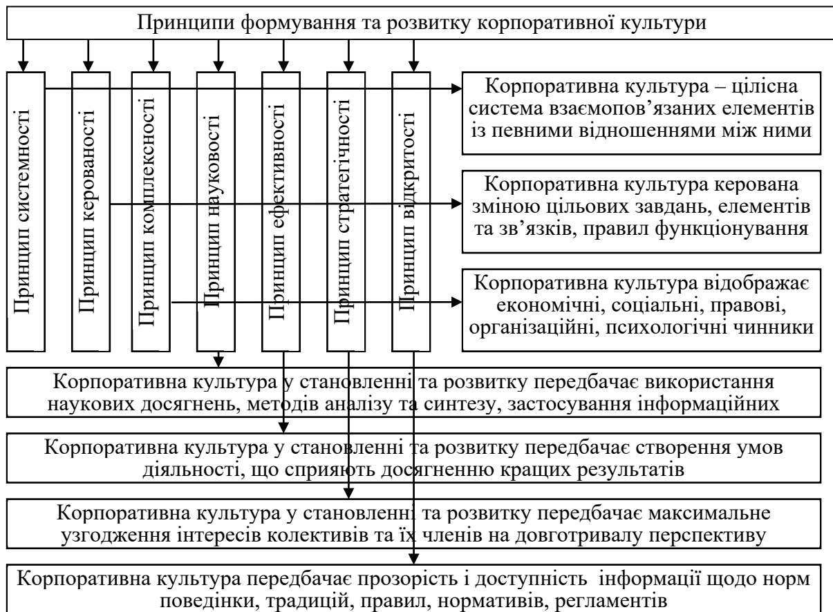
Рис. 1. Роль корпоративної культури та принципи її формування Схема розроблена авторами на основі узагальнення наукових джерел.

З нашої точки зору, доцільно розглядати корпоративну культуру в якості підсистеми організаційної культури підприємства. Така підсистема відображає сукупність певних цінностей, норм і моделей поведінки, які декларуються, поділяються і реалізуються на практиці керівниками підприємств та їх підлеглими (персоналом), доводячи свою ефективність в процесі адаптації до потреб внутрішнього розвитку організації та вимог зовнішнього середовища. Узагальнення наукової думки дозволяє стверджувати, що успішна реалізація корпоративної культури потребує дотримання принципів системності, керованості, комплексності, науковості, ефективності, стратегічності та відкритості (рис.1).