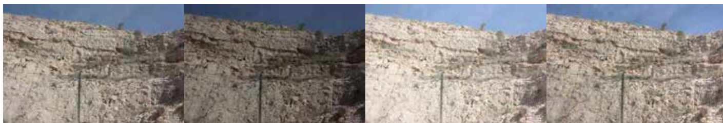
Figura 2: Imágenes originales (superior) y la obtenida mediante la técnica HDR (inferior).

En el caso de estudio se efectuó una cobertura fotográfica general con una base fotográfica de 2 m, con un total de 91 fotografías, a una distancia media de 20 m, una escala aproximada de 1/850, mediante posicionamiento de la cámara sobre un trípode; para cada posición se tomaron 3 fotografías en forma de ráfaga para utilizar el sistema HDR (Figura 2). En algunas posiciones fue necesario, para cubrir toda la superficie de la pared motivo de estudio, efectuar una terna fotográfica desde cada posición fotográfica, una fotografía horizontal, otra contrapicada, y otra oblicua.