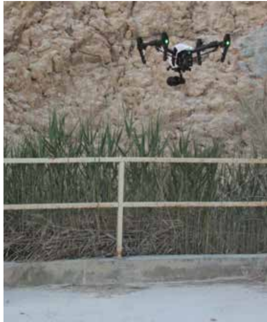
Figura 1. Utilización de cuadricóptero para obtención de fotografías.

Todas las técnicas terrestres expuestas tienen dificultades en común. Por un lado, si se desea una alta densidad de datos o resolución, es necesario acercarse a la zona de estudio con el riesgo que ello conlleva. Por otro lado, para completar los modelos es necesario capturar desde muchas posiciones, que no siempre son accesibles. Todo esto se puede evitar mediante el empleo de fotogrametría aérea usando UAV (Figura 1).