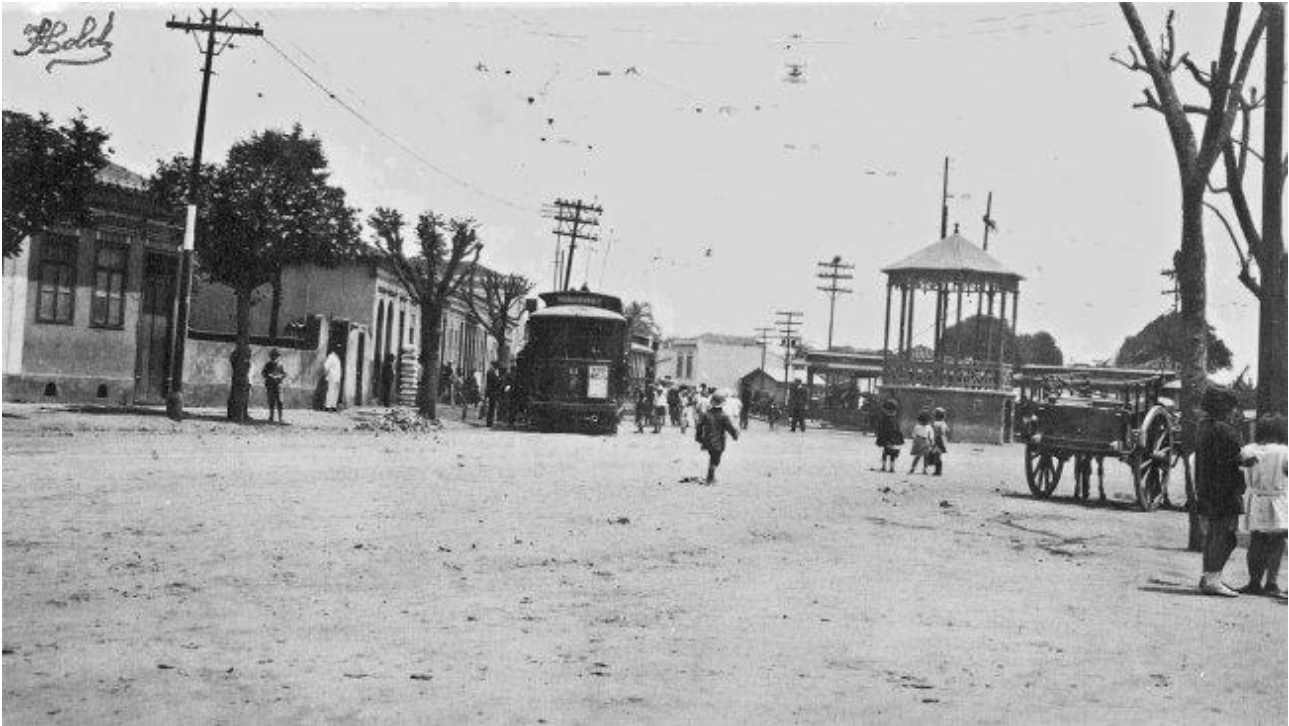
Largo de Pinheiros: primeira linha de bonde chegou ao bairro em 1909.

Entre outras mudanças significativas nesse ambiente citadino, uma das mais importantes para esse contexto, e também com reflexo em toda a cidade, foi a retificação do Rio Pinheiros com o objetivo de abastecimento da Represa Billings (idealizado e construído entre as décadas de 1920 e 1940), visto como solução de energia abundante e mais barata. Esta mudança, operada primeiramente no final da década de 1930 e posteriormente novas intervenções no final da década de 1950, transformou a relação do rio com a cidade.