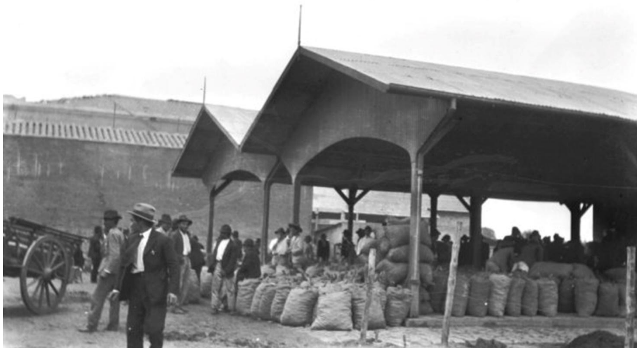
Antigo Mercado dos Caipiras, anos 1910.

A partir da implantação inicial do comércio de produtos agrícolas, a região se consolidou tendo como centralidade o Largo de Pinheiros e o Mercado dos Caipiras, ampliando a diversidade de serviços e comércio. Casas de produtos e especiarias típicas de diversas regiões do país, como as de influência nordestina, são exemplos que contribuíram para o futuro de um lugar que veio a ter uma diversidade de etnias, crenças e atividades. Foi inaugurado nesse contexto, em 1907, o Entrepósito, atual Mercado Municipal de Pinheiros na rua Pedro Cristi, localizado entre as ruas Cardeal Arcoverde e Teodoro Sampaio.