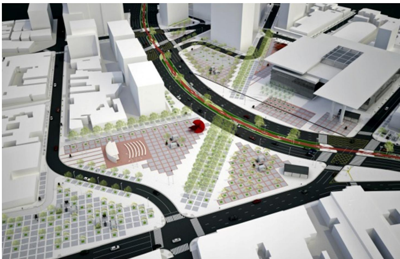
Vista geral da praça da Proposta vencedora no concurso para Reconversão Urbana.

Com intenção de ampliar os espaços a serem conectados ao Mercado Municipal, foi proposto uma Esplanada composta por novas praças entre as ruas Teodoro Sampaio e Pedro Cristi, favorecendo o acesso de pedestres à atividade comercial e também aos edifícios, possibilitando a locação de espaços para feira livre permanente em busca da recuperação das atividades típicas de seu antigo eixo comercial. Antes à céu aberto, o terminal de ônibus foi transferido para um quilômetro mais próximo à marginal do Rio Pinheiros. A proposta contou com um sistema viário de conexão para facilitar a circulação entre a Esplanada e o Terminal Pinheiros, removendo travessias e aliviando os cruzamentos em busca de melhor acessibilidade. Finalmente, o programa básico previu projetos arquitetônicos indutores de regeneração urbana com serviços urbanos e edifícios culturais: estacionamentos subterrâneos, praça comercial, torre de serviços, centro de eventos e auditório, entre outros, visando a consolidação de uma “renovação” a partir da conversão urbana e transformação do cotidiano dos moradores e transeuntes deste contexto urbano.