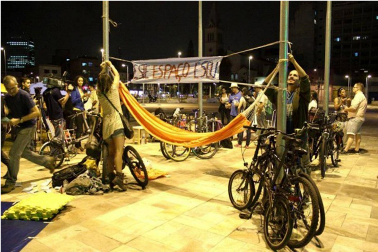
Ocupação regular colaborativa “A Batata Precisa de Você”.Largo da Batata, Pinheiros, São Paulo.

Criou-se, em consequência da dimensão que esse espaço tomou atualmente, uma dinâmica de cultura em sociedade que se soma como mais um cenário. Este processo, além do resultado da ação dos movimentos de ocupação e também do valor semântico dessa paisagem para os tempos atuais, é também o reconhecimento deste como um espaço democrático, de cidadania e civilidade. Entendido a partir de estudos de Durkheim em Duhram (2004), pode-se dizer que este é também um espaço de “racionalidade, luta e confronto”, coexistente ao cenário de sentido comunitário, “que se inspira em uma compensação de interesses por motivos racionais (de fins e valores) ou de uma união de interesses com igual motivação”.