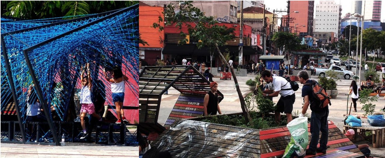
Mobiliários Urbanos e Plantio Coletivo (respectivamente), construídos por ações coletivas de ocupação. Largo da Batata, Pinheiros, São Paulo.

Entre algumas delas é curioso destacar os movimentos “Rede do Forró” e “A Batata Precisa de Você”, que buscam a transformação do espaço com qualidade de convivência e fortalecendo as relações com a memória. Esses, e uma série de outros pequenos movimentos presentes, estão possibilitando debates sobre a memória local, construção de mobiliários urbanos, oficinas, atrações musicais, entre outras atividades que fazem em parcerias com outros grupos e também com a prefeitura. A proposta destes grupos é ampliar a discussão sobre o papel do espaço público hoje e também aproximar a população às ações de poder público.