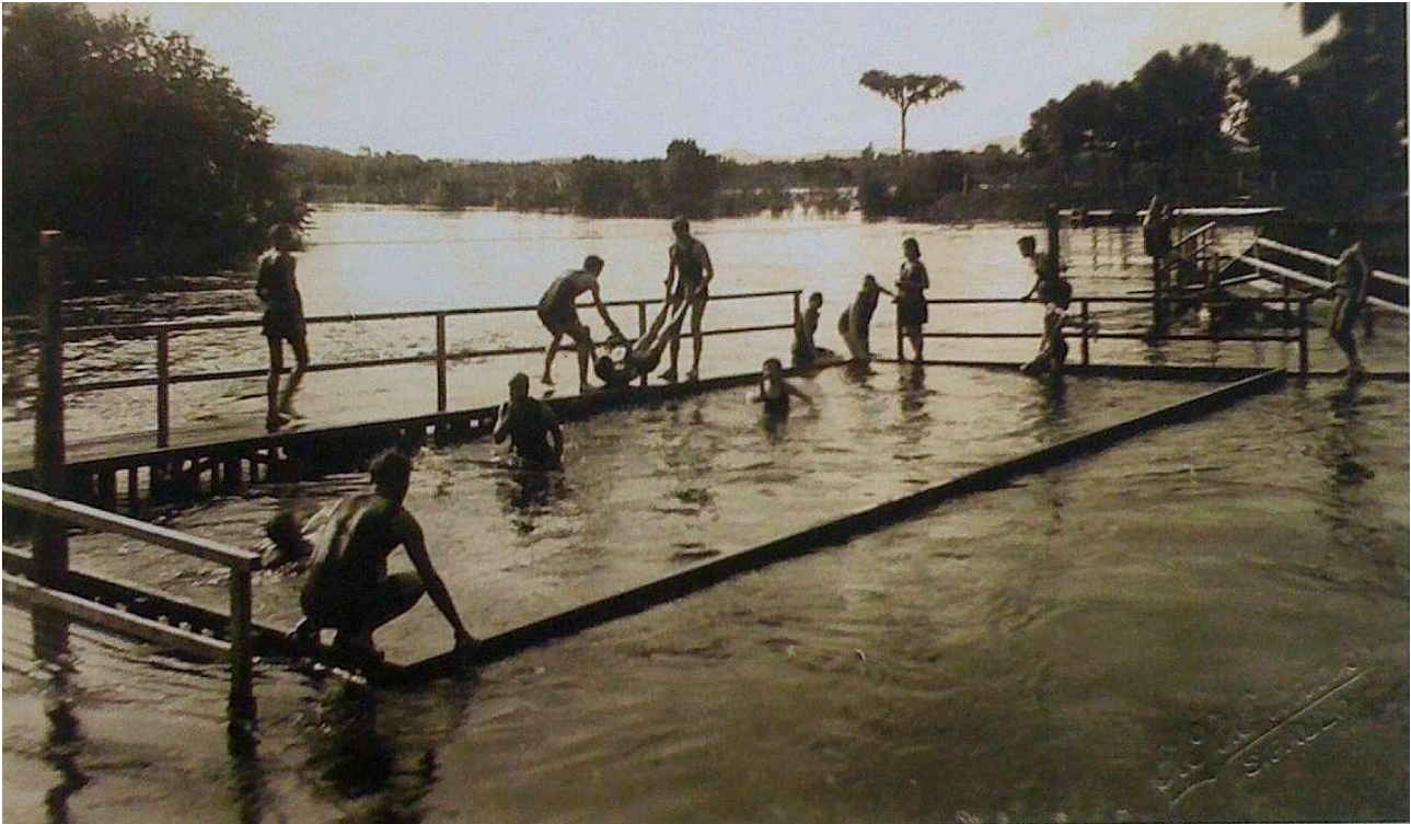
Piscina no Rio Pinheiros. Década de 1920.