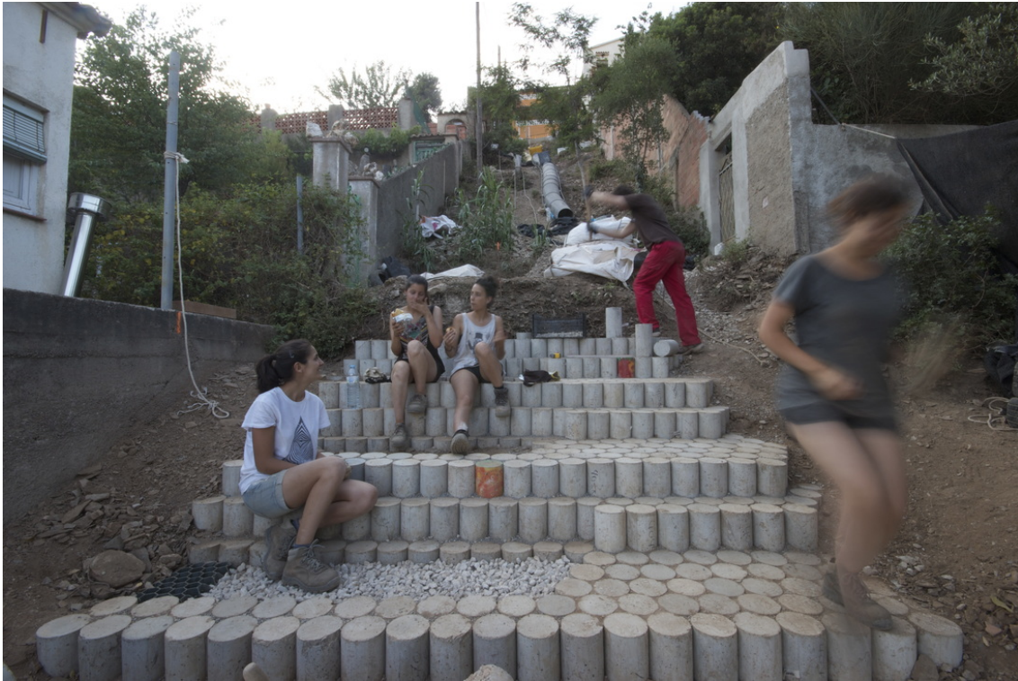
Imatge 2: Ruta Ringo-Rango, a Les Planes, alumnes de l'escola d'arquitectura del Vallès, 2015.