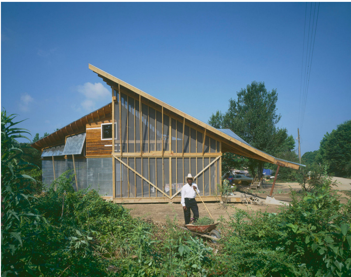
Imatge 1: Harris/Butterfly House, Rural Studio, 1996.