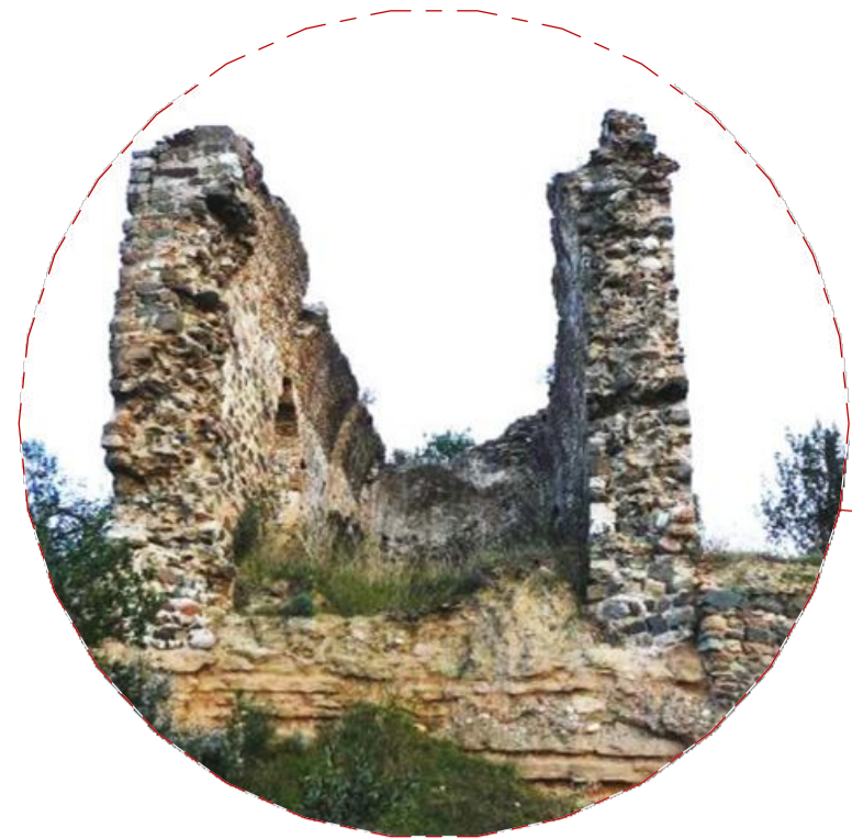
Castell de Voltretra (s. xi, Sant Pere de Voltretra) but | coberta | nau | direccionalitat | conjunt | sistema