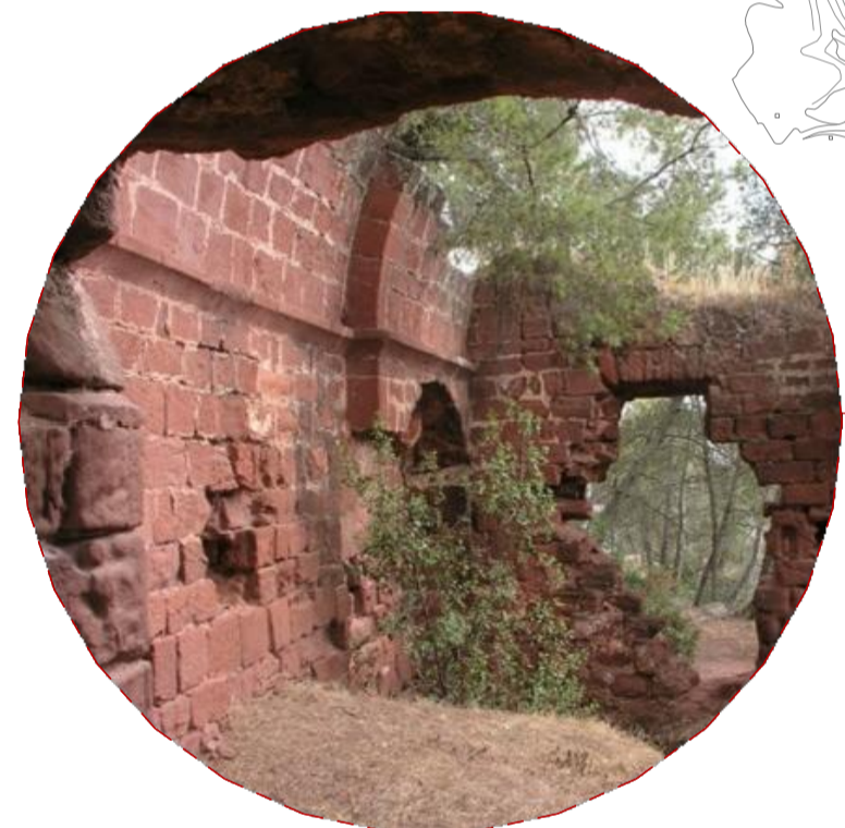
Castell de Cervelló (s. xi, Cervelló) pati | claustra inventit | successió de plans | consistència murària | materials argilosa | altat