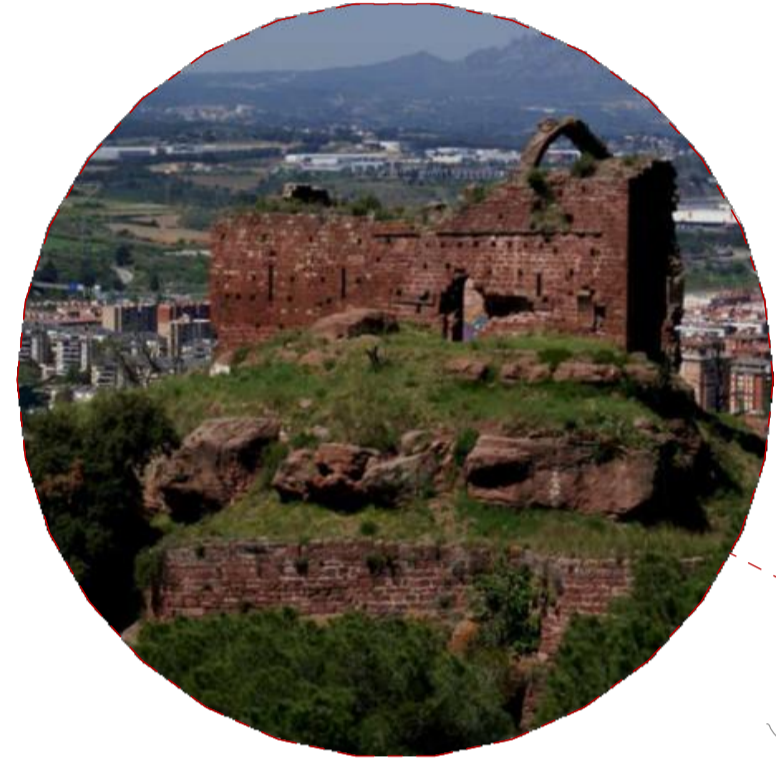
Castell de Rocafort (ss. xi-xii, Sant Genís de Rocafort) but | coberta | nau | rodger | basament perimetral | altat