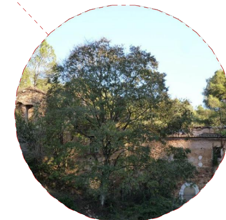
Ermita de Santa Maria de Valldonzella (s. xi, Collserola) consolidar