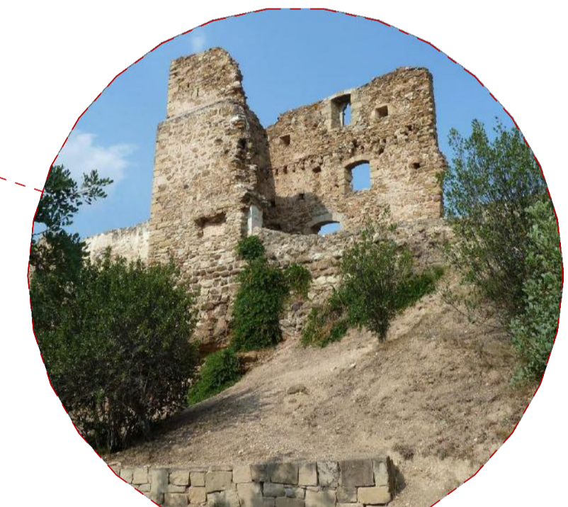
Castell de Castellciuró (ss. xi-xii, Molins de Rei) completar la cantonada | coberta | desnivell | lèxes | aterrossat nivell inferior | condició d'interioritat