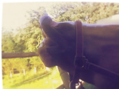
Slika 3. Podizanje gornje usne