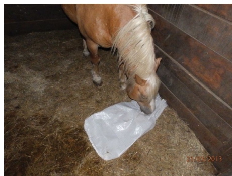
Slika 4.b. Grizenje vreće