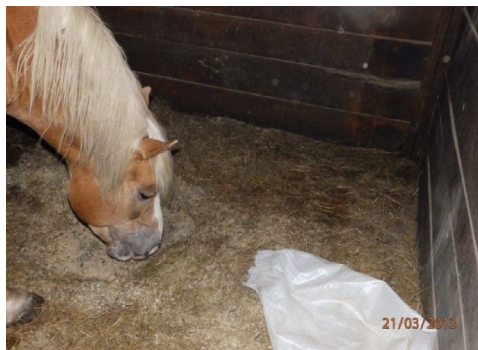
Slika 4.a. Prilaženje vreći

na drugu stranu i počeo jesti sijeno. Vreća je ostala jedan sat u boksu, a on je ovu radnju ponovio još četiri puta po tri minute.