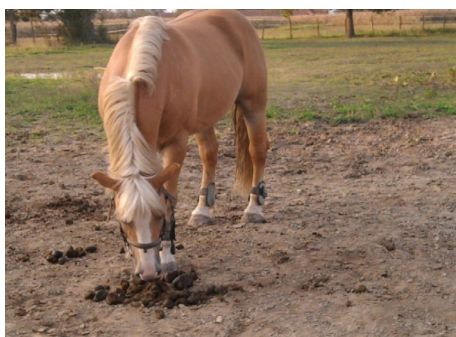
Slika 2. Pastuh njuši izmet kobile

redišta okoštavanja kostiju prsne peraje dobrog dupina dobro su vidljiva na rendgenogramima i prikazana su u tablici 2. Stupnjevi okoštavanja i sraštavanje pojedinih središta pokazuju određenu pravilnost u kostima prsne peraje. Tako su u novorođenčadi i plodova pred kraj gravidnosti (npr. dupin 18, slika 2 lijevo) razvijene lopatica, nadlaktična, palčana i lakatna kost, te sve kosti zapešća osim lateralne zapešćajne kosti, sve kosti pešća, sedam članaka drugog prsta, pet članaka trećeg prsta, dva članka četvrtog prsta, dok članci prvoga i petog prsta nedostaju. Mlade jedinke dobrog dupina (npr. dupin 55, slika 2 sredina) imaju u proksimalnom dijelu prsne peraje početno okoštale epifize, a u distalnom dijelu još nije ni došlo do okoštavanja. U zrelih je jedinki (npr. dupin 38, slika 2 desno) vidljivo potpuno sraštavanje epifiza s dijafizama i u proksimalnim i distalnim dijelovima prsne peraje.