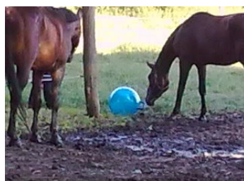
Slika 1.b. Njuškanje lopte na podu