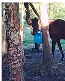
Slika 1.a. Njuškanje lopte koja je privezana za drvo