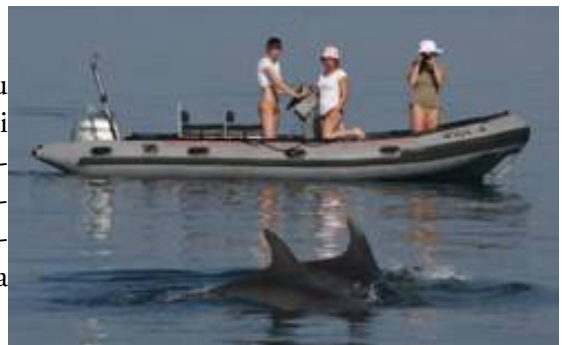
Slika 1. Gumena brodica

Neposredno promatranje morskih sisavaca u njihovu staništu zbog utvrđivanja pojavnosti i rasprostranjenosti provedeno je u razdobljima navedenim u tablici 1 u moru Šibensko-kninske županije. U tu je svrhu korištena gumena brodica (slika 1) devet dana, jedrilica (slika 2) deset dana i avion jedan