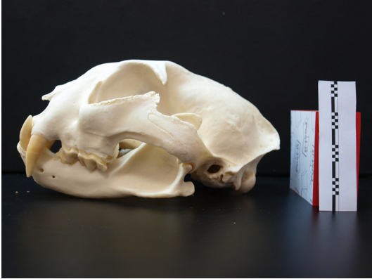
Slika 2: Zubalo risa ( Lynx lynx ). Vidljivo je skraćivanje lubanje, naglašeni očnjaci i derači te sekodontno zubalo.

a znatno više u kitova zubana. Jedna od zanimljivosti derača je njihov način zatvaranja u vidu "dvostruke giljotine" (Savage, 1976.). Time se u početnom dijelu zatvaranja čeljusti derači dotiču u stražnjem dijelu, a tek kad su usta zatvorena i u prednjem dijelu. Ovakav model omogućuje stvaranje velike sile ugriza na maloj površini (Savage, 1976.). Prema Christiansenu i Adolfssenu (2005.) jačina ugriza mjerena na deračima najveća je u lava ( Panthera leo ) 3405 N, zatim tigra ( Panthera tigris ) 3007 N i polarnog medvjeda ( Ursus maritimus ) 2403 N. Za razliku od derača, očnjaci služe za probadanje i usmrćivanje, a u kombinaciji s prednjim ekstremitetima i za pridržavanje plijena. U pravilu su u kopnenih mesojeda očnjaci gornje i donje čeljusti podjednako razvijeni. Neke su vrste razvile posebno velike i masivne očnjake, primjerice medvjedi i velike