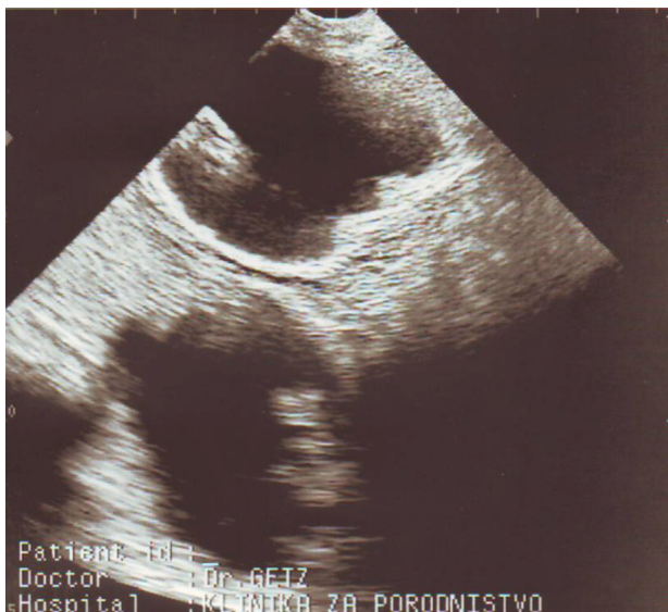
Ehogram 1: Blizanačka gravidnost u kobile (47. dan nakon pripusta).

teralnoj gravidnosti. Pri jednostranoj fiksaciji došlo je do spontane redukcije manjega blizanca u 22 od 22 kobila (100%), kada su zametni mjehurići bili različite veličine (više od 4 mm razlike u dijametri). Kod zametnih mjehurića iste veličine do spontane redukcije jednog blizanca došlo je u 73% slučajeva (u 19 od 26 kobila). Na osnovi ovih rezultata pretpostavio je da veći mjehurić ometa i/ili onemogućuje unošenje hranjivih tvari u manji zametni mjehurić, jer je veći dio područja stijenke zametnog mjehura koji će biti reduciran pokriven stijenkom prilagođenog zametka koji će preživjeti. Od 85% redukcija do 40. dana gravidnosti u slučaju jednostrano fiksiranih blizanaca, 59% redukcija pojavilo se između 17. i 20. dana, 27% između 21. i 30. dana, a 14% između 31. i 38. dana (Ginther, 1989b). U kobila gravidnih više od 40 dana (ehogram 1) dodatnu poteškoću pri dijagnostici stvara i češća pojavnost embrionalne smrtnosti u slučaju blizanaca. Ako do embrionalne smrti dođe nakon 36. do 40. dana gravidnosti, kada su već formirane endometrijske čašice, kobile zbog toga ne ulaze u ciklus sljedećih nekoliko mjeseci te vlasnici zbog izostanka ponovnog estrusa smatraju da su kobile ždriježne.