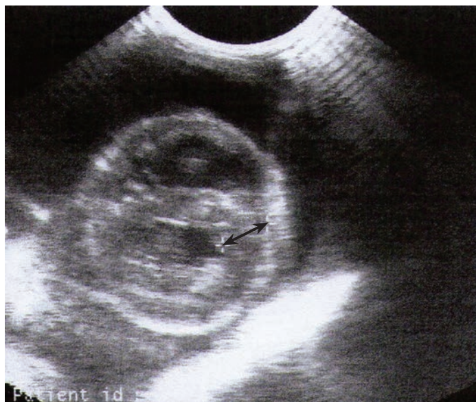
Slika 2. Desni parasternalni poprečni presjek lijevog i desnog ventrikula. Vidljiva je hipertrofija miokarda lijevog ventrikula, pa i papilarnih mišića. Debljina interventrikulskog septum (strelica) iznosi 8,6 mm.