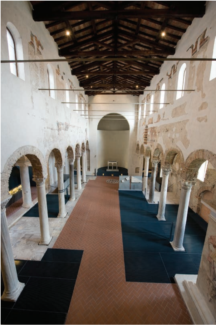
Fig. 3 – Brescia, basilica di San Salvatore.

chiostri 14 attorno a cui si distribuivano gli ambienti della vita quotidiana, la sala capitolare, il palazzo abbaziale, il refettorio, la cucina, il parlatorio, il dormitorio e i locali amministrativi. A settentrione del cenobio nell'XI secolo