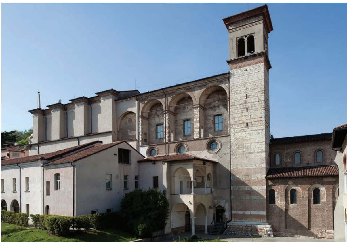
Fig. 1 – Brescia, monastero di San Salvatore-Santa Giulia, fianco sud della basilica, del coro delle monache e della chiesa di Santa Giulia.

veniva fondata dal duca Desiderio su terre concesse dal re Astolfo l'abbazia femminile di San Salvatore (fig. 1). La data è riportata nel Rituale liturgico o Ordinario 3 – fatto copiare nel 1438 sulla base di un testo della fine del XII secolo – per fissare nella memoria della comunità religiosa il ricordo delle origini, caricandolo di una forte valenza evocativa relativa all'anno mitico della fondazione di Roma 4 . Nonostante il riferimento celebrativo, l'istituzione del cenobio benedettino – diretto da subito dalla figlia di Desiderio e Ansa, la badessa Anselperga – si colloca a metà del secolo VIII 5 : ciò avvenne, secondo il praeceptum del gennaio 759 6 , sulle strutture di un precedente edificio tardo antico e di una cappella, dedicata ai santi Michele arcangelo e Pietro. L'intitolazione al Salvatore è documentata già l'anno successivo (760) 7 e solo a partire dal 915 8 compare la dedicazione a santa Giulia, il cui titolo si alterna a quello del Salvatore fino alla seconda metà del XII secolo, per poi sostituirlo in modo definitivo.