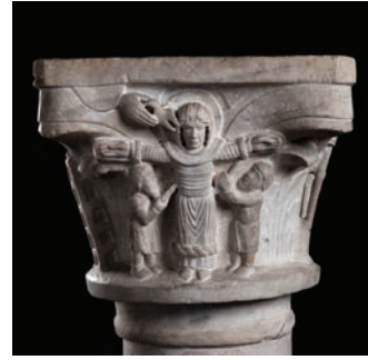
Fig. 6 – Brescia, Musei Civici, capitello proveniente dalla cripta, martirio di santa Giulia.