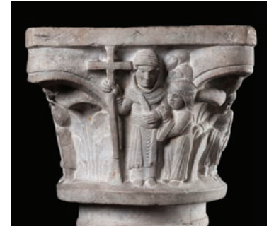
Fig. 7 – Brescia, Musei Civici, capitello proveniente dalla cripta, santa Giulia con Fede, Speranza e Carità.

L'attestazione più conosciuta è il capitello (figg. 4, 5, 6, 7) che proviene dalla cripta di San Salvatore 74 , realizzato in occasione dell'ampliamento della confessione nella seconda metà del XII secolo, in concomitanza con le grandi trasformazioni del monastero, quando, oltre all'edificazione di Santa Maria in Solario, si adattò il cuore liturgico della fondazione e la basilica venne impreziosita da campagne pittoriche e da nuovi edifici. La necessità di un luogo più ampio per la venerazione delle sacre spolia portò alla trasformazione della cripta e si passò da un ambiente ipogeo, a cui si accedeva mediante corridoi anulari, ad una più grande struttura ad oratorio che conservava le arche con le reliquie e consentiva una migliore fruizione dei percorsi liturgici 75 .