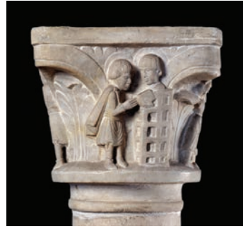
Fig. 5 – Brescia, Musei Civici, capitello proveniente dalla cripta, sant'Ippolito e san Lorenzo.