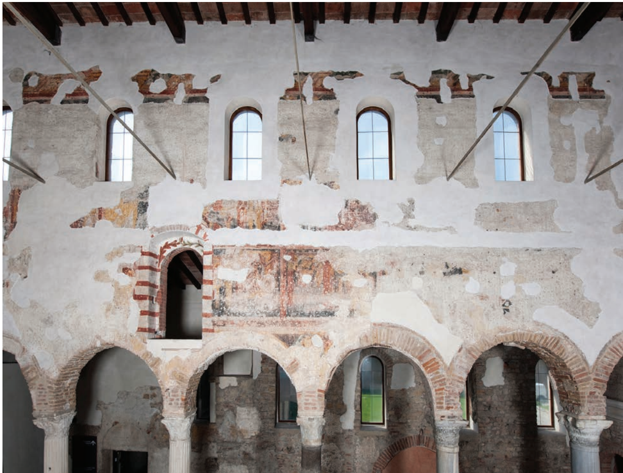
Fig. 8 – Brescia, basilica di San Salvatore, navata centrale, parete meridionale.