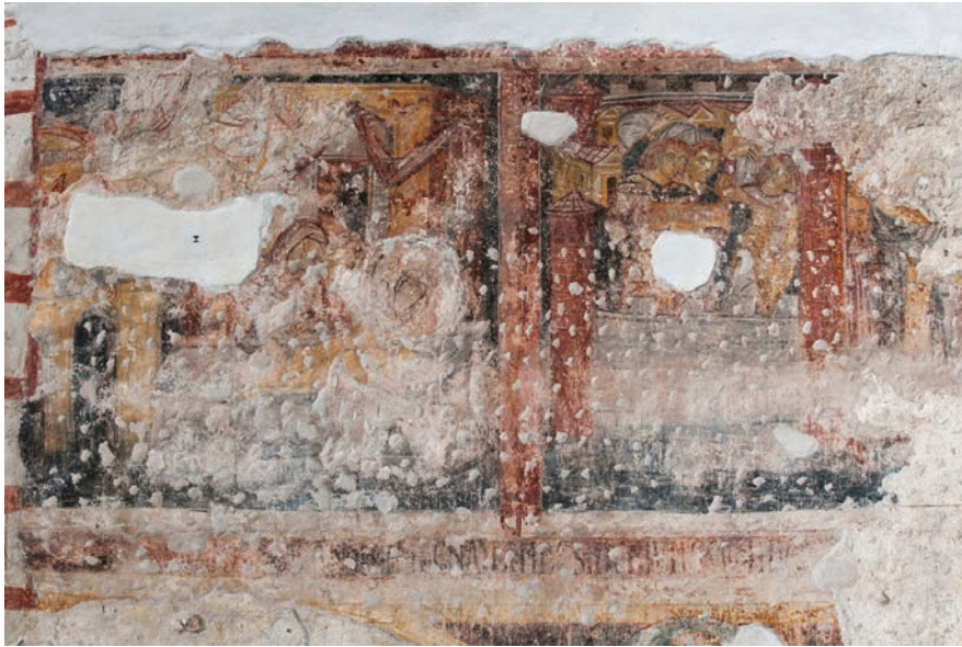
Fig. 10 – Brescia, basilica di San Salvatore, navata centrale, parete meridionale, affresco, deposizione di un corpo in un sarcofago (a sinistra), trasporto di una salma da una città (a destra).