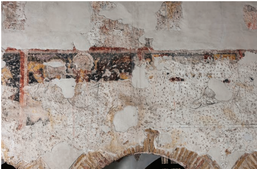
Fig. 11 – Brescia, basilica di San Salvatore, navata centrale, parete settentrionale, affresco con martirio di Agape e tortura nell'olio di Elpis.

mini che reggono sulle spalle un fardello. Nei piccoli brani vi hanno visto episodi delle vite di santi e tra questi la presa di Cartagine, tratta dalla passio di santa Giulia.