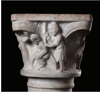
Fig. 4 – Brescia, Musei Civici, capitello proveniente dalla cripta, martirio di san Pimeneo.