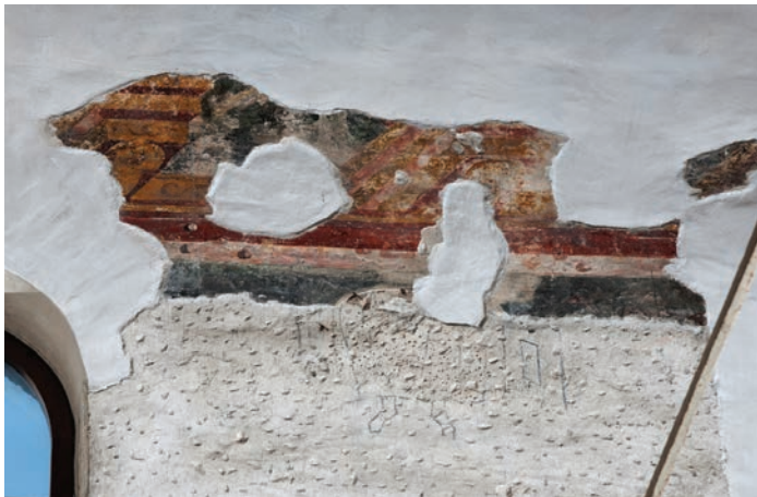
Fig. 9 – Brescia, basilica di San Salvatore, navata centrale, parete meridionale, affresco, mensolone prospettico.

all'età carolingia, mentre le recenti ricerche, condotte da Gian Pietro Brogiolo 83 , tendono a collocare all'epoca longobarda. Tralasciando questi aspetti critici, va rilevato che in età medievale le superfici della navata centrale e delle