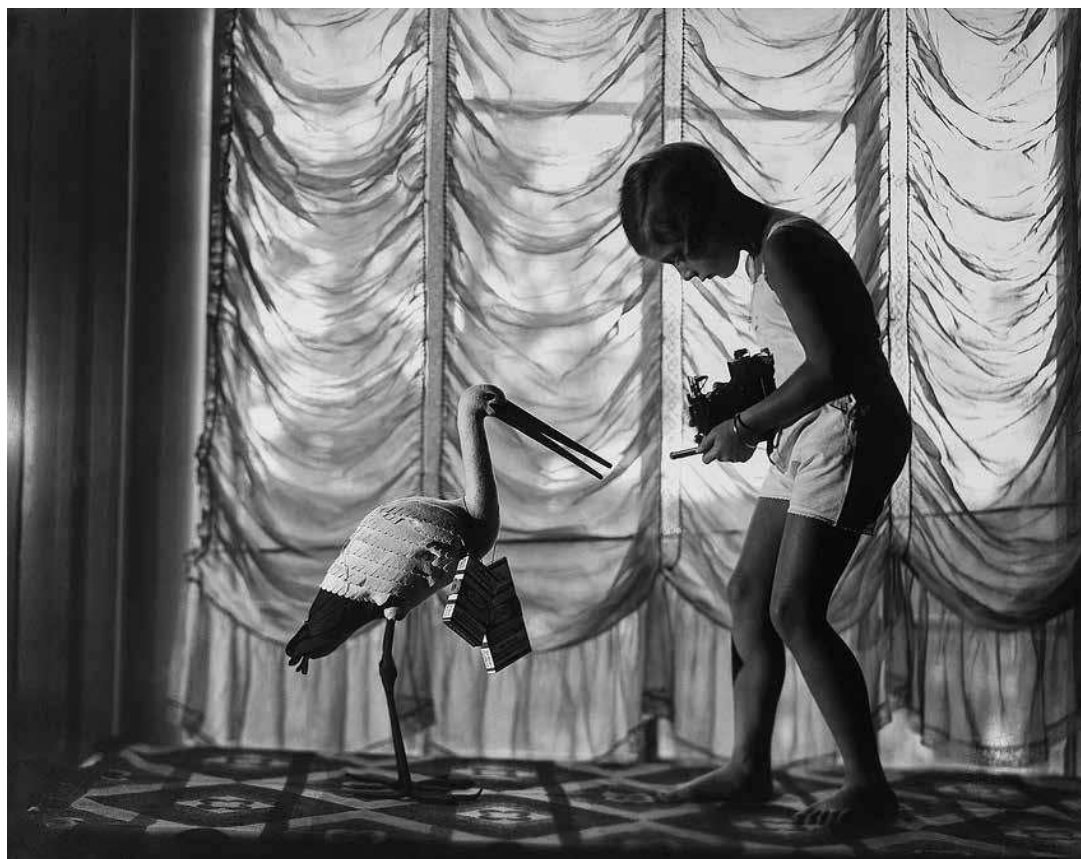
sl.16.-18. Postav izložbe Foto Tonka – Tajne ateliera društvene kroničarke Galerija Klovičevi dvori, Zagreb