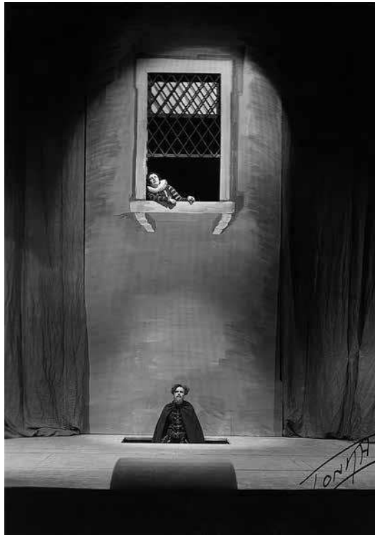
sl.7. Scena iz baleta Žar ptica Igora Stravinskog, 1923. srebrnoželatinska fotografija Odsjek za povijest hrvatskog kazališta HAZU, Zagreb