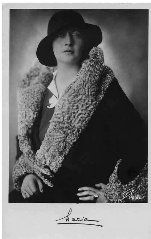
sl.10. Marija Karadžorđević, 1931. srebroželatinska fotografija / silver gelatin print Muzej grada Zagreba, MGZ 54217

fotografije, a ne digitalni ispis, te smo u najvećem dijelu izložbe uživali u kvaliteti doživljaja originala.