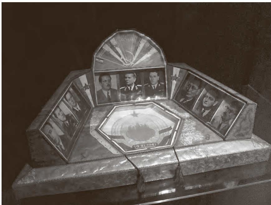
o Iz postava izložbe Refleksije vremena, Klovićevi dvori str. 62-66