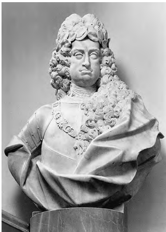
↑ Francesco Robba, Karlo VI , Gradski muzej, Ljubljana