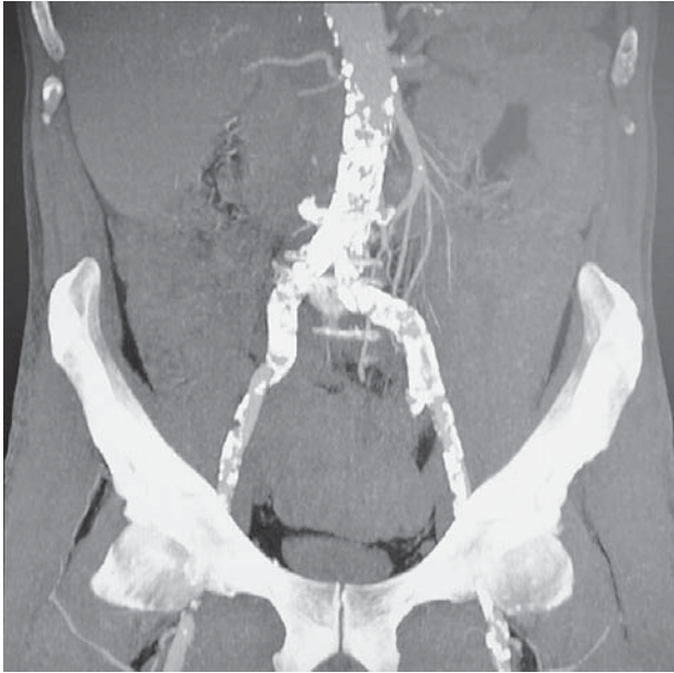
Slika 1. Prikaz izražene ateroskleroze distalnog dijela abdominalne aorte i ilijakalnih arterija obostrano (MS-CT angiografija).

Figure 1. Severe atherosclerosis of distal part of abdominal aorta and both iliac arteries (MS-CT angiography).