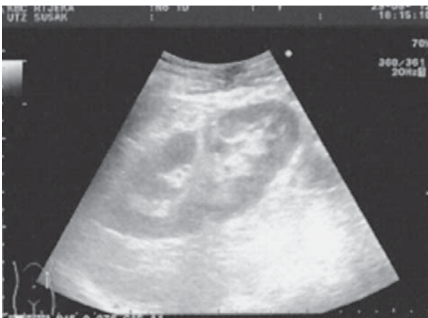
Slika 2. Ultrazvučni prikaz normalnog presatka u lijevoj lumbalnoj loži.

Figure 1. Severe atherosclerosis of distal part of abdominal aorta and both iliac arteries (MS-CT angiography).