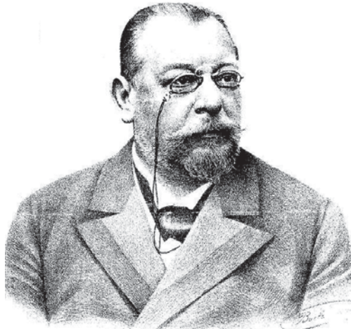
Slika 1. Prof. Julius Glax, europski balneološki autoritet, popularizirao Opatiju kao europsko morsko klimatološko lječilište krajem 19. stoljeća Figure 1. Prof. Julius Glax, European balneological authority, who popularized Opatija as a European marine climatological health resort at the end of the 19 th century