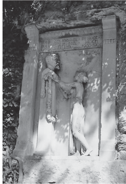
Slika 5. Spomen-obilježje prof. Robertu Kochu u znak zahvalnosti za suzbijanje malarije na Brijunima

Prof. dr. Leopold Schrötter Ritter von Kristelli (Graz, 5. 2. 1837. – Beč, 22. 4. 1908.), austrijski je laringolog i internist. U Beču je osnovao prvu Katedru za laringologiju 1868.,