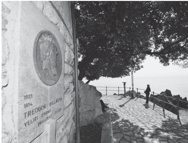
Slika 2. Spomen-ploča prof. Theodoru Billrothu na opatijskom šetalištu Lungomare Figure 2. Memorial plaque of Prof. Theodore Billroth on Opatija seaside promenade Lungomare

za počasnog člana Zbora liječnika Hrvatske. Schwerdtnerov reljef Billrotha iz 1907. s natpisom Dem großen Arzt und Förderer des Kurortes («Velikom liječniku i unapreditelju lječilišta»), uništen je za vrijeme Drugoga svjetskog rata, a nova Dolinarova spomen-ploča postavljena je 1965. s natpisom: »Veliki kirurg i prijatelj Opatije«, nekoliko metara južnije na zid crkvice sv. Jakova (slika 2).