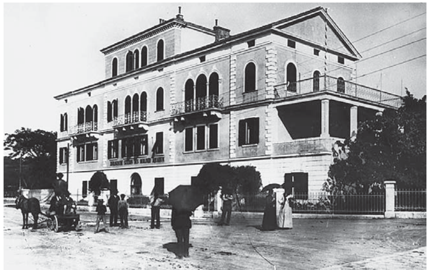
Slika 3. Rovinjski institut – Centar za istraživanje mora kojemu je gostujući znanstvenik bio Rudolf Virchow Figure 3. Rovinj institute – Centre for Marine Research where Rudolf Virchow was a guest scientist

Prof. dr. Robert Koch (Clausthal, 11. 12. 1843. – Baden-Baden, 25. 5. 1910.) njemački je bakteriolog. 1882. otkrio je uzročnika tuberkuloze koji je po njemu nazvan Kochov bacil. Također je pronašao uzročnike kolere (1883.), ispitivao malariju i afričku bolest spavanja te uveo liječenje kininom. Godine 1905. dodijeljena mu je Nobelova nagrada za medicinu. 14 Na poziv austrijskog industrijalca Paula Kupelweisera, koji je 1893. kupio Brijune i kasnije ih pretvorio u mondni turistički centar, stigao je sa suradnicima 1900. i 1901. i suzbio epidemiju malarije na Brijunima. 15 Ta metoda liječenja prenijeta je na istarsko kopno i otoke Cres i Lošinj. Kochov mikroskop, koji je upotrebljavao pri otkrivanju uzročnika malarije u krvi bolesnika na otoku, danas se nalazi u Muzeju na Velom Brijunu (slika 4). U znak zahvalnosti Paul Kupelweiser na otoku mu je podigao spo-