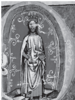
Bela IV. (1235.–1270.)