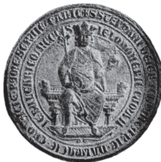
Stjepan V. (1270.–1272.)