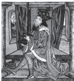
Ladislav IV. Kumanac (1272.–1290.)