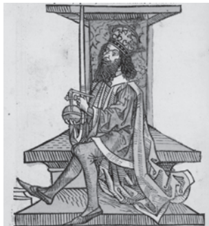
Andrija II. (1205.–1235.)

No uskoro, 1295. godine kuga je pokosila Karla Martela pa je papa Bonifacije VIII. odredio njegova sina Karla Roberta za budućeg ugarsko-hrvatskoga kralja. Pavao Šubić tada je otvoreno stao na stranu Karla Roberta Anžuvince jer je preko njegove majke Marije iz dinastije Arpad bio njegov rođak.