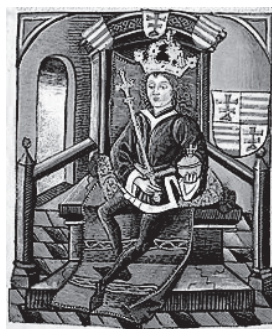
Ludovik I. Veliki (1342.–1382.)