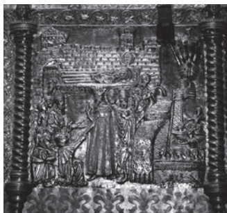
Ludovik I. Anžuvina 1358. ulazi u Zadar. Prizor na škrinji sv. Šimuna u Zadru

Budući da je postigao mnoge uspjehe na unutarnjem i vanjsko-političkom polju, s p avom je dobio nadimak Ludovik I. Veliki. Umro je godinu dana nakon mira u Torinu, 10. IX. 1382. Na mađarskom prijestolju naslijedila ga je starija kći Marija, a na poljskom mlađa kći Jadviga.