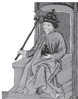
Andrija III. Mlečanin (1290.–1301.)