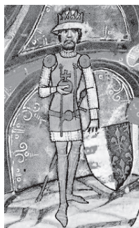
Karlo I. Robert (1301.–1342.)