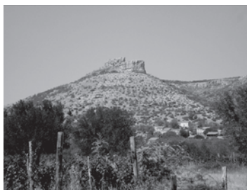
Lijevo: Položaj i ostatci utvrde Bribir Pavla I. Šubića na Bribirskoj glavici. Sredina: Prikaz Pavla I. Šubića na škrinji sv. Šimuna u Zadru. Desno: Ostatci utvrde Ostrovice na prijelazu između Ravnih kotara i Bukovice u Zadarskoj županiji.

Prema posjedima koje je Pavao I. Šubić dobio od Karla Martela, u ispravi iz 1298. nazivao se „ banom čitave Hrvatske ”; u ispravi od 7. travnja 1299. nazvao se „ ban Hrvatske i Dalmacije i gospodar Bosne ”, a u ispravi od 4. siječnja 1307., izdanj u