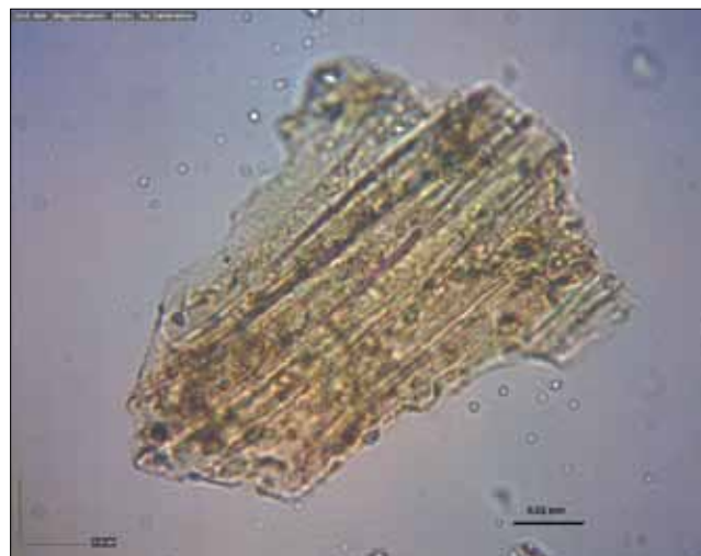
Sl. 5 i 6 Mikroskopski preparat s izdvojenim zrnima vulkanskog stakla iz sloja tefre veličine do 50 mikrona (DIV-2) – smeđa zrna s paralelnim crnim crtama Fig. 5 and 6 Microscopic sample with grains of volcanic glass from the tephra layer up to 50 microns big (DIV-2) brown grains with parallel black lines

nizacije, područje južno od Plana nije bušeno. Detaljno su opisani i uzorkovani profili (DIV-1 i DIV-2) aluvijalnih naslaga koji u sebi sadrže proslojke crvenih paleotala (debljine do 20 cm; sl. 3). Na profilu DIV-2 osim aluvijalnih (holocenskih naslaga) s klastima krednih vapnenaca i proslojcima crvenih paleotala, utvrđen je i isprekidan sloj starijih paleotala koja su razvijena na eocenskim flišnim naslagama. Ovaj sloj paleotala nije prisutan kontinuirano nego na većini pregledanih profila nedostaje i aluvijalne (holocenske?) naslage neposredno leže na naslagama fliša. Pri dnu izdanka s paleotlom razvijenim na flišu utvrđeno je postojanje izdužene leće tefre žuto-narančaste boje debljine do 8 cm i ukupne dužine od 4 m (sl. 4, 5 i 6).