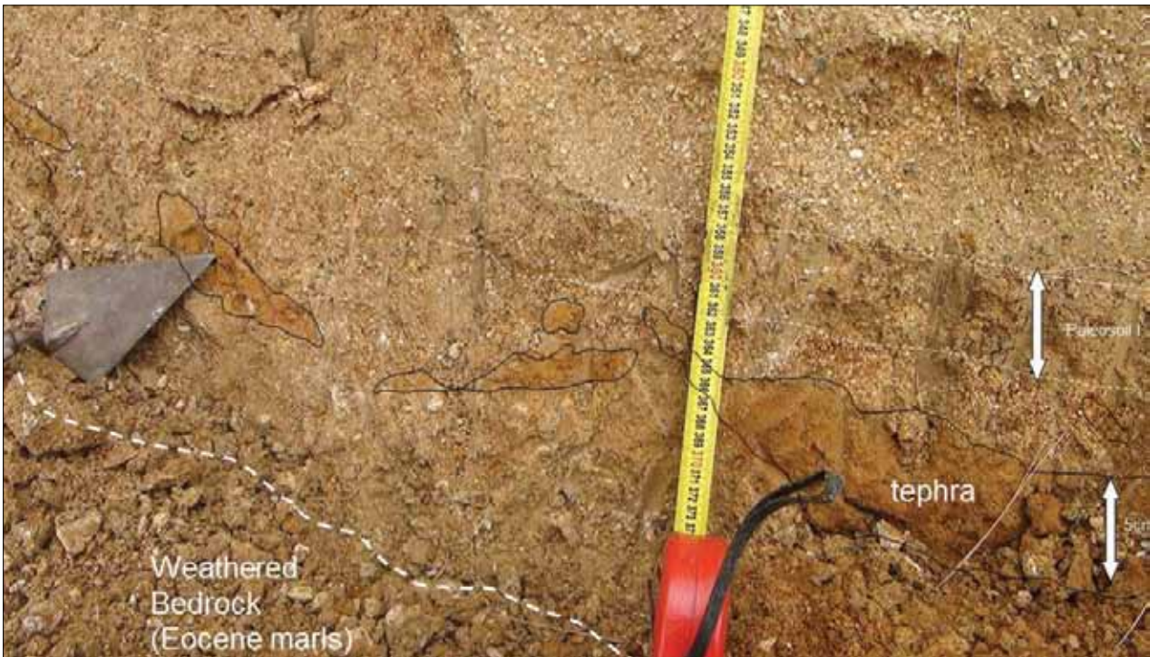
Sl. 4 Detaljni prikaz tefre unutar profila paleotla (DIV-2)