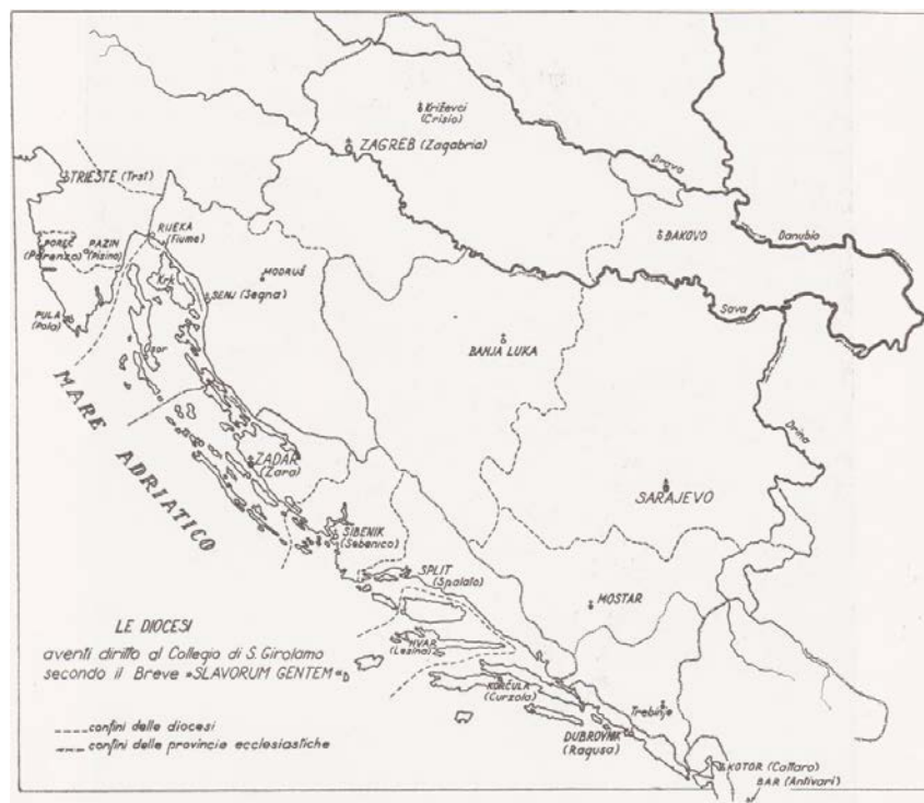
Karta biskupija koje imaju pravo na Zavod sv. Jeronima (J. Magjerec, Hrvatski zavod sv. Jeronima u Rimu , Gregoriana, Rim 1953., 42.)

Nakon što je papa Siksto V. 1859. g. bulom Sapientiam Sanctorum 1 uz crkvu osnovao i Kaptol (koji se sastojao od prepozita, šest kanonika i četiri beneficijata) te spomenuo u dokumentu ilirsku naciju, počelo se postavljati pitanje koja to područja obuhvaćaju tzv. „ilirsku pokrajinu“ iz koje se mogu slati hodočasnici i kanonici u svetojeronimske ustanove. Ovo je pitanje bilo toliko delikatno da je zbog njega u drugoj polovici XVII. st. nastao spor pred sv. Rotom 2 , najvišim crkvenim sudom u Rimu. Pitanje je bilo, obuhvaća li provincia nationis Illyricae Štajersku, Kranjsku i Korušku kako se u njima govori slovenski jezik, odnosno imaju li Slovenci pravo na svetojeronimske ustanove? Odluka je bila da se pod ilirskom pokrajinom u istinitom i pravnom smislu razumije Dalmacija, čiji su dijelovi Hrvatska, Bosna i Slavonija, a isključene su Koruška, Štajerska i Kranjska. Osim njih, ovom su odlukom isključeni i Hrvati oko Bara. 3