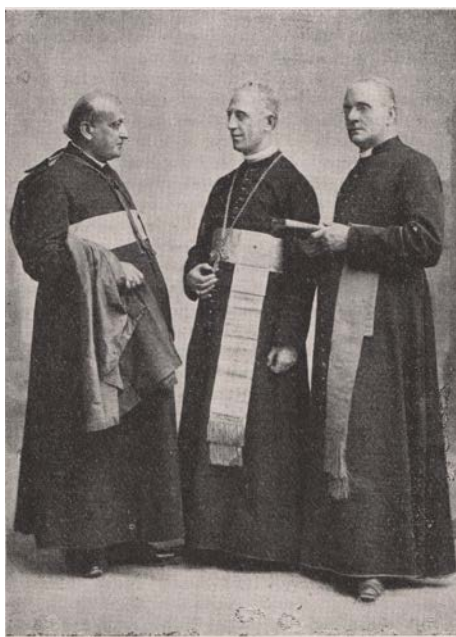
Slika nadbiskupa u Rimu

(J. Magjerec, Hrvatski zavod sv. Jeronima u Rimu, Gregoriane, Rim, 1953., 55. )