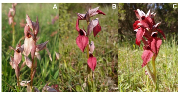
Slika 1. Cvat: A) Serapias lingua , B) Serapias × ambigua i C) Serapias cordigera (Foto: Lj. Borovečki-Voska, Medulin - Centinere, 30. travnja 2016.).

Svojta S. × ambigua Rouy ex E.G.Camus opisana je 1892. godine iz Francuske kao hibrid između vrsta Serapias cordigera L. × Serapias lingua L. (Camus 1892, Rouy 1912). Dosad je zabilježena u većini europskih mediteranskih država (Francuska, Španjolska, Portugal, Italija, Grčka – Kreta, Ex Jugoslavija – bez navođenja lokaliteta, niti imena sadašnjih država), ali i u sjevernoj Africi (Alžir i Maroko) (Lumare i Medagli 2015, The Plant List 2016, IPNI 2016, Anonimus 2016). Prvi i dosad jedini nalaz ove svojte u hrvatskoj flori objavljuje 2009. godine Griehl u svom radu „Die Orchideen Istriens und deren Begleitflora“ (Griehl 2009). U radu se navodi lokalitet sjeveroistočno od Medulina, a nađene su četiri hibridne jedinke.