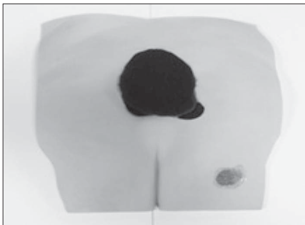
Sl. 2. Protektivna podloga