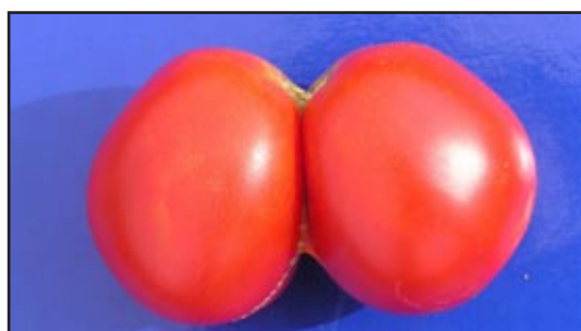
Slika 4: Srašćivanje plodova kao posljedica suboptimalnih temperatura

U kasnijim stadijima razvoja suboptimalne temperature također mogu značajnije utjecati na prinos i kvalitetu plodova. Niske temperature tijekom diferencijacije staničnog tkiva generativnih organa mogu uzrokovati razvoj većeg broja karpalnih listova plodnice zbog čega dolazi do pojave srašćivanja dvaju ili više plodova, rebravosti plodova i različitih njihovih deformacija.