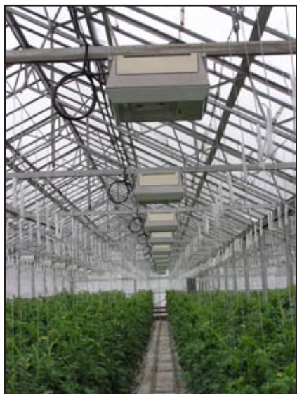
Slika 6: Dodatno osvjetljenje pri zimskom uzgoju u zaštićenim prostorima