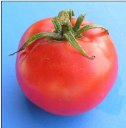
Slika 10: Uzdužna puknuća ploda