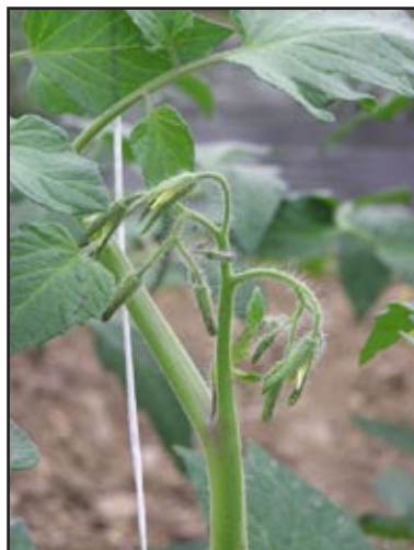
Slika 2: Presadnice rajčice stradale od niskih temperatura

Budući da se komponente prinosa diferenciraju u ranijim stadijima razvoja biljke, izuzetno je važno kakvim je uvjetima biljka tada bila izložena. Rajčica je naročito osjetljiva na temperaturne uvjete tijekom uzgoja presadnica. Naime već kod razvijena tri prava lista započinje zametanje cvatova pa ako su u to vrijeme presadnice izložene temperaturama 13 - 15°C, prvi cvatovi će se zametnuti nisko na biljci već nakon 5 - 6 listova, ali će se ako niske temperature duže potraju, cvatnja prolongirati.