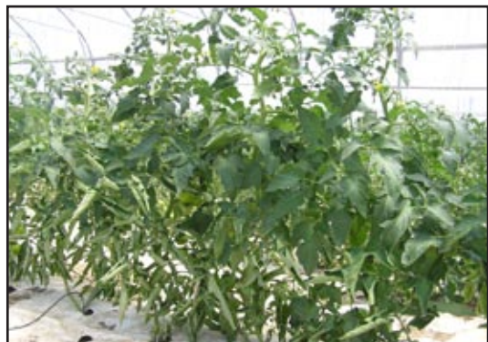
Slika 12: Uvijanje listova uvjetovano intenzivnim svjetlom i visokim temperaturama

Jedna od fizioloških poremetnji koja se očituje na listovima je njihovo uvijanje. Često puta se u proizvodnji uvijanje listova poistovjećuje s bolestima pa se primjenjuju nepotrebne mjere kemijske zaštite. Do uvijanja listova prema središnjoj žili dolazi na najdonjim etažama kada su uvjeti za fotosintezu izuzetno povoljni, a zamatanje i razvoj plodova na biljkama je slab. U takvim se uvjetima asimilati stvoreni u listovima nedovoljno brzo translociraju u reproduktivne organe biljke pa povišeni sadržaj škroba i šećera u listovima uvjetuje njihovo uvijanje. Sa smanjenjem intenziteta osvjetljenja i temperature i intenzivnijim razvojem reproduktivnih organa simptomi uvijanja listova nestaju.