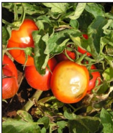
Slika 8: Sunčana palež plodova rajčice

Sunčane se opekotine javljaju na plodovima kao posljedica intenzivnog sunčevog zračenja i visokih temperatura. Na plodovima koji su nakon razvoja u zasjeni lišćem, najčešće zbog gubitka lisne mase, izloženi izravnom sunčevom svjetlu zbog visokih temperatura ne dolazi do stvaranja pigmenata, pa