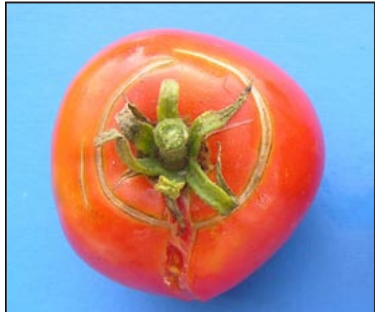
Slika 11: Radijalna puknuća ploda

Jedini način da se izbjegne pucanje plodova je kontinuirano održavanje optimalne vlažnosti tla neophodne za normalan rast i razvoj plodova.