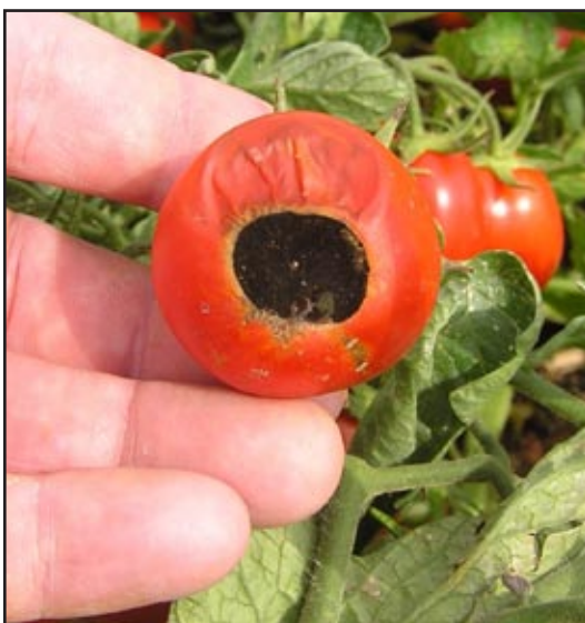
Slika 7: Vršna trulež plodova kao posljedica diskontinuiteta u opskrbi vodom

Iako rajčica ima dobro razvijen korijen, posebice kod proizvodnje izravnom sjetvom, te može koristiti vlagu iz tla bolje nego većina drugih povrtnih kultura, za sigurnu proizvodnju i u klimatski prosječnim godinama treba računati s navodnjavanjem. Najveće potrebe za vodom rajčica ima tijekom perioda intenzivnog rasta i formiranja plodova. Diskontinuitet u opskrbi vodom uzrokuje pojavu vršne truleži i pucanja plodova. Preobilna pak vlaga, kako u tlu tako i u zraku, nepovoljna je zbog mogućnosti intenzivnijeg razvoja bolesti. Optimalna vlažnost tla za uspješan uzgoj rajčice je 60 - 70% maksimalnog kapaciteta tla za vodu.