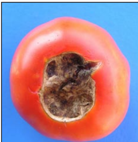
Slika 9: Vršna trulež plodova rajčice uvjetovana visokim temperaturama i nedostatkom vlage

na tom dijelu ostaju blijedi. Pojava sunčanih opekotina može se spriječiti uzgojem sorata dobre lisnatosti i kvalitetnom zaštitom kojom se sačuva lisna masa.