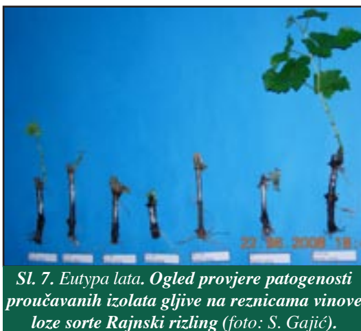
Sl. 7. Eutypa lata . Ogljed provjere patogenosti proučavanih izolata gljive na reznicama vinove loze sorte Rajnski rizling (foto: S. Gajić).

Pri proučavanju patogenih odlika proučavanih izolata na neožiljenim reznicama vinove loze utvrđeno je da su sve testirane sorte te biljne vrste osjetljive prema svih šest proučavanih izolata gljive (sl. 7), ali je ustanovljeno da među pojedinim sortama postoje određene manje razlike u pokazivanju osjetljivosti, odnosno otpornosti prema tom parazitu, kao i da postoje manje razlike u pojavi stupnju patogenosti, odnosno virulentnosti, među pojedinim izolatima.