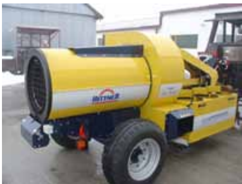
Slika 3. Hunterfrost H-210 (lovac mraza), Hittner d.o.o.

Prednosti primjene Frostbustera u odnosu na druge načine zaštite od mraza: