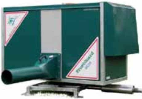
Slika 5. Frostguard

Suvremena oprema za prognozu pojave mraza prikazana je na slici 6. Oprema je ugrađena u hermetički zatvoreno kućište otporno na različite vremenske uvjete. Uređaj je opremljen s GSM Modemom tako da se putem mobilnog telefona u svakom trenutku (trenutno) može doći do izmjerenih podataka i pravovremeno reagirati i zaštititi nasade od mraza. Mjerno područje za temperaturu je od -20^{\circ}\text{C} do +120^{\circ}\text{C} , uz točnost mjerenja \pm 0,2^{\circ}\text{C} .