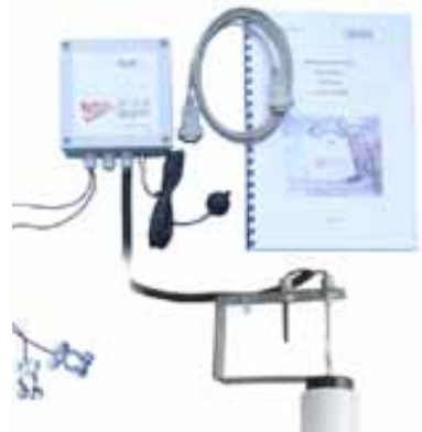
Slika 6. Oprema za prognozu pojave mraza

kao što je to slučaj kod drugih izvedbi. Utrošak benzina za pogon ventilatora se kreće 3-4 L/sat.