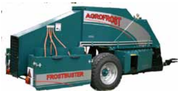
Slika 4. Suvremeni Frostbuster

Suvremena izvedba Frostbustera“ prikazana je na slici