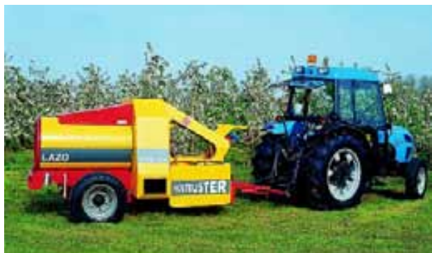
Slika 2. Frostbuster u radu

Tretman je učinkovitiji ako je inverzioni stup niži od visine stabla (Milodanović, 2006.). Ugrijani zrak diže se samo dok se obogaćuje zrakom iste temperature u inverzionom sloju. Dakle kvalitetnim prijenosom topline dolazi do strujanja zagrijanog zraka u prostoru voćnjaka pa se tako smanjuje radijacijski stup, čime se smanjuju oštećenja od niskih temperatura (slika 1).