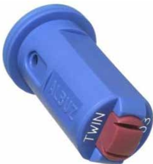
Slika 1. Mlaznica AVI TWIN 110-03

Spada u skupinu anti-drift mlaznica namijenjenih za upotrebu u širokom rasponu radnog tlaka (3 do 7 bara). Sastoji se od dvaju keramičkih otvora koji omogućuju visoku preciznost i otpornost na trošenje. Između dvaju mlazova nalazi se kut 60°, a izlazni kut pojedinog mlaza iznosi 110°. Prvi mlaz usmjeren je pod kutom od 30° unaprijed u smjeru vožnje, a drugi pod kutom od 30° nasuprot smjeru vožnje. Mlaznica osigurava ravnomjernu raspodjelu kapljica na terenu, a nagib mlaznice poboljšava dubinu penetracije kapljica u biljku. Uz pomoć Venturi učinka za stvaranje mjehurića zraka u kojem se nalazi sredstvo za prskanje, kapljice su velike i ispunjene zrakom. Na taj način smanjuje se drift i poboljšava se naslaga na biljke. Minimalna visina armature iznad biljki iznosi 50-60 cm (Catalogue Albuz, 2009).