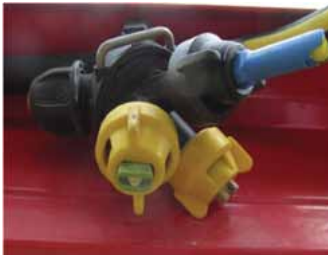
Slika 4. Lechler LU 120-03

Mlaznica Lechler LU je univerzalna poboljšana standardna mlaznica s izlaznim kutom 120^\circ kod protoka od 0,3 galone/minuti koja se koristi za nanošenje svih sredstva za zaštitu bilja i regulatora rasta. Taj tip mlaznica koristi se u području radnog tlaka od 1,5 do 5 bara. Mlaznica tipa Lechler LU može proizvesti razne veličine kapljica - od vrlo finih do ekstremno velikih. Veličina kapljica varira ovisno o radnom tlaku. U praksi su postignuti vrlo dobri rezultati prskanja također kod brzine vožnje od 10 km/h, potrošnje vode od 130 l/ha te radnog tlaka od 2,5 bara (Lechler Katalog 2010).