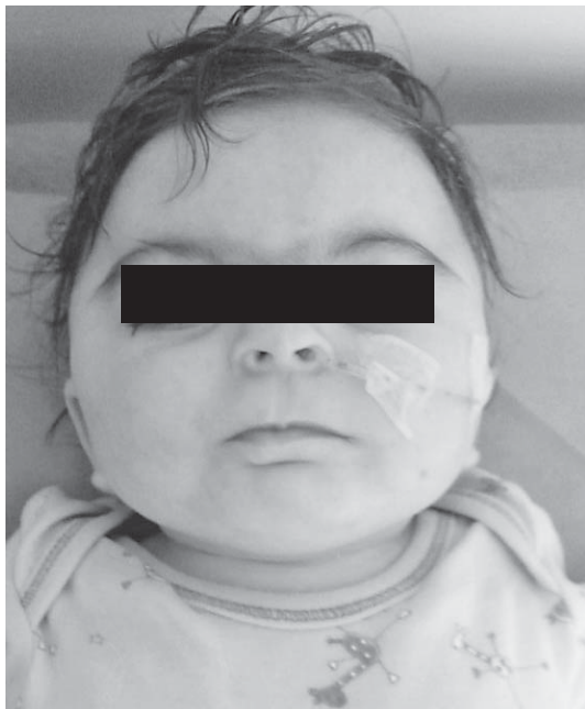
SLIKA 1. Karakterističan izgled bolesnika sa sindromom Cornelia de Lange

Postoje određeni poremećaji kao što su Frynssov sindrom, fetalni alkoholni sindrom te neki kromosomski poremećaji kao