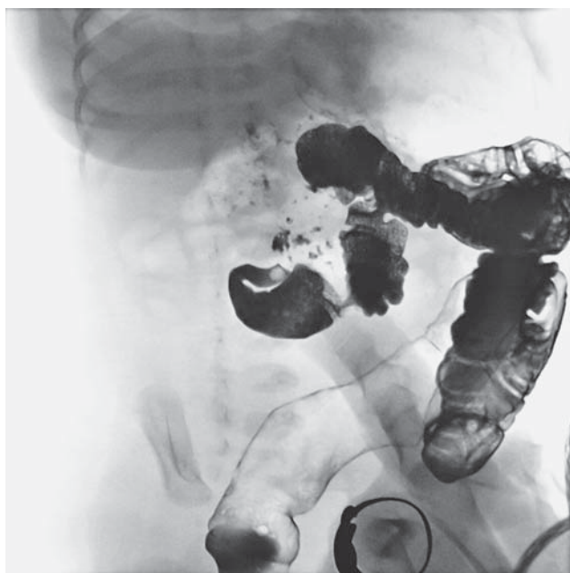
SLIKA 4. Pasaža crijeva (barij) - medijalni položaj cekuma, kolon u cijelosti u lijevom hemiabdmenu

što su parcijalna duplikacija 3q, delecija kromosoma 2q31 (slični redukcijski defekti udova), koji dijele određene kliničke karakteristike s CdLS-om i diferencijalno dijagnostički o njima treba razmišljati. Stoga je u naše bolesnice, radi potvrde dijagnoze i pravilnog genetičkog informiranja obitelji, započeta genetička obrada molekularnom dijagnostikom.