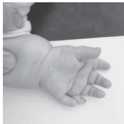
SLIKA 2. Anomalije šaka