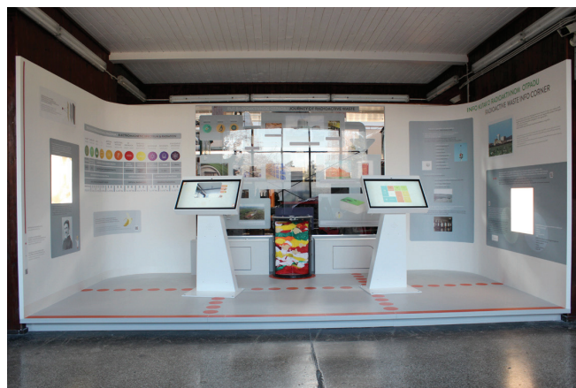
Slika 1 – "Info kutak o radioaktivnom otpadu", dio stalnog postava u Tehničkom muzeju Nikola Tesla 2

Specifičnost hrvatskog programa gospodarenja RAO-om svakako je u tome što, iako na neki način traje još od 1979. godine, 1 nikada nije uključivao sustavni program informiranja/educiranja/uključivanja javnosti. Premda je objavljen niz publikacija na tu temu, do nedavno se nije ozbiljno prišlo tom problemu. Tako je u posljednjih nekoliko godina poduzet niz inicijativa s ciljem informiranja javnosti, od kojih treba izdvojiti "Info kutak o radioaktivnom otpadu", novi dio stalnog postava u Tehničkom muzeju Nikola Tesla (slika 1).