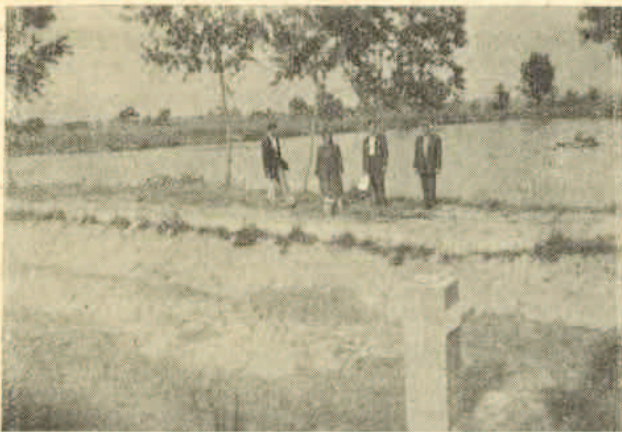
Ribnjak, sprijeda zimovnik