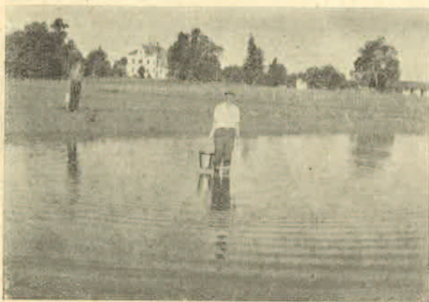
Prenos šarana u rižina polja. Pozadi uprava Zadruga

zadružna priredba, koja je završena rižinom večerom. Ove godine znatno su povećana rižina polja. Uz to je jedan dio rižišta zasađen sadnicama riže iz kljalista tokom mjeseca juna. Zadrugari, a još više okolna sela velikim interesom prate sve faze uzgoja riže. To su dosada najsjevernija rižna polja u NR Hrvatskoj. Napućenost je ovdje razmjerno velika, a radne snage ima dovoljno u bližoj okolini.