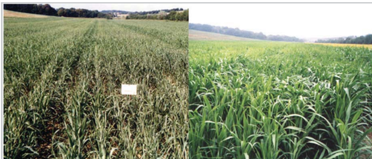
Figure 2. Hybrid sorghum, height 57cm (15 th of August) and 110 cm (16 th of September)