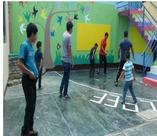
Figura 03: Ejecución de dinámicas en el patio del CAEF.