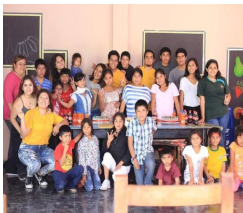
Figura 05: Último taller con los niños del CAEF.