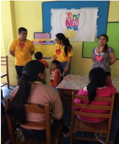
Figura 01: Segundo taller sobre La Autoestima