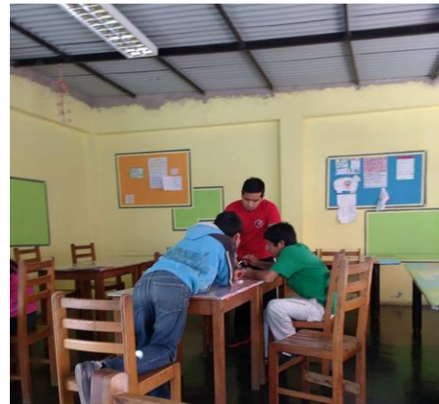
Figura 04: Asesoría en tareas escolares